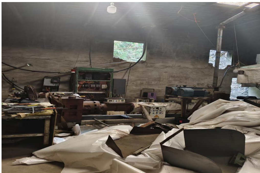
图 2 现场图片

事故发生后，经现场查验：现场为一条塑料造粒生产线，伤者是在投料进塑料粉碎机时造成的卷入机械伤害，投料处杂物较多，无固定的操作平台。