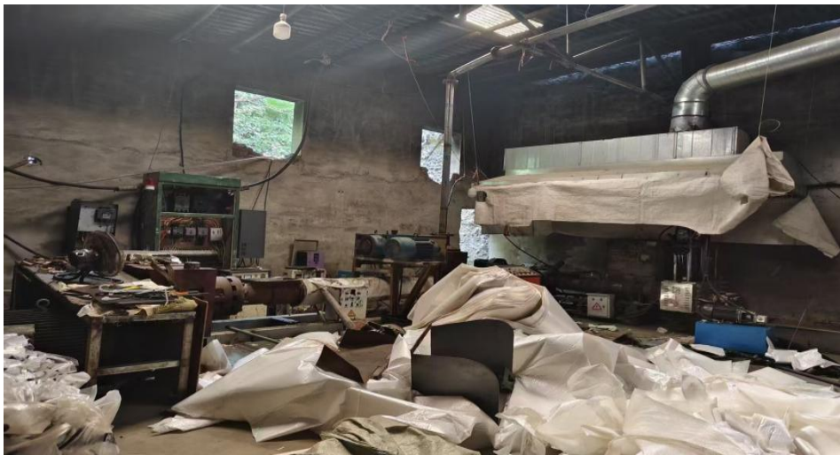
图 1 主要设备

2025 年 2 月份，叶某某租用了回收部约 150 平米厂房从事废旧塑料的回收加工，新装一条造粒生产线。2025 年 4 月份开始投用生产，其工艺流程为：收集→破碎→分离除杂→熔融→切粒，主要设备情况见图 1。