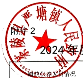
2024年度部门整体支出绩效评价基础数据表