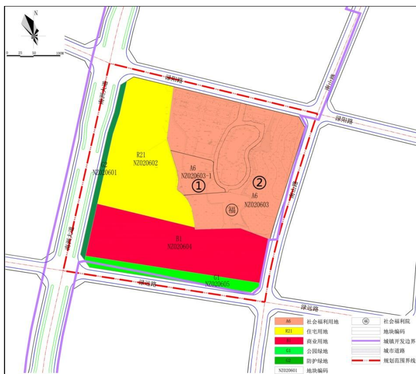
拟修改方案示意图