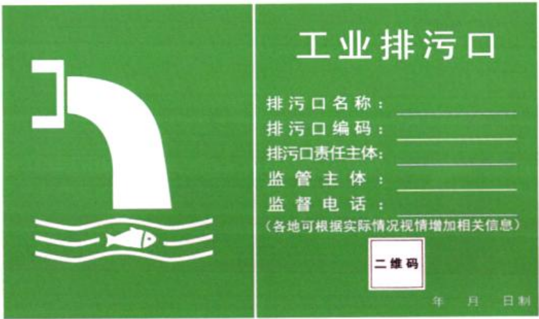
图 5-1 废水排污口图形标志

按照《长江、黄河和渤海入海（河）排污口排查整治分类规则（试行）》《长江、黄河和渤海入海（河）排污口命名与编码规则（试行）》《长江、黄河和渤海入海（河）排污口标志牌设置规则（试行）》的通知（环办执法函〔2020〕718）等文件有关规定，在排污口附近设置环境保护图形标志牌，填写本工程的主要污染物；标志牌必须保持清晰、完整，发现形象损坏、颜色污染或有变化、褪色等不符合图形标志标准的情况，应及时修复或更换，检查时间至少每年一次。工程后入河排污口的标识牌位置仍设置在原处，但需对二维码等相关信息进行更新。