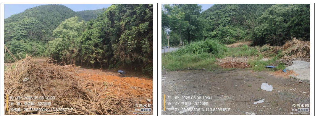
原人民煤矿废水处理站生态环境现状

本工程占地为林地，占地范围内未见需特殊保护的珍稀濒危植物、古树名木等。评价范围内不涉及珍稀濒危野生保护动物集中分布区。