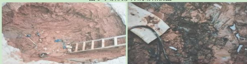
图 6 新挖沉沙井坑内状况