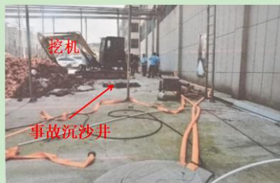
图 2 事故现场方位(由南向北拍摄)