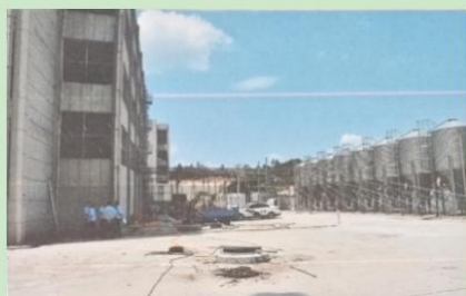
图 1 事故现场方位(由北向南拍摄)