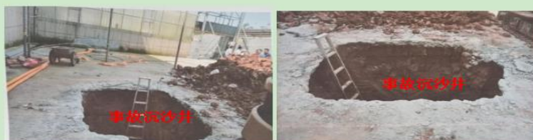
图 5 事故沉沙井现场概貌图