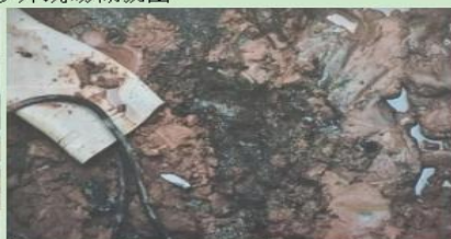
图 7 新挖坑内底部疑似排污管局部管体