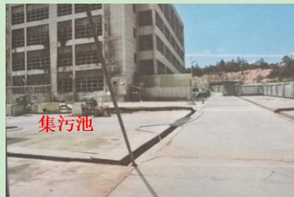
图 3 一分厂保肥区集污池方位