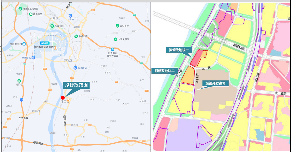
论 证 说 明

本次修改是按照国家及株洲市相关法律、法规、标准、规范及规定进行调整，现对规划修改的内容及影响总结如下：