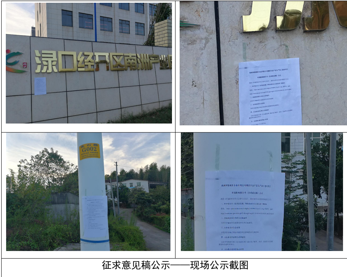
征求意见稿公示——现场公示截图