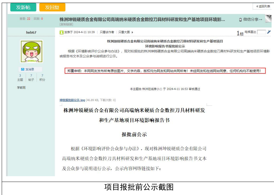
项目报批前公示截图