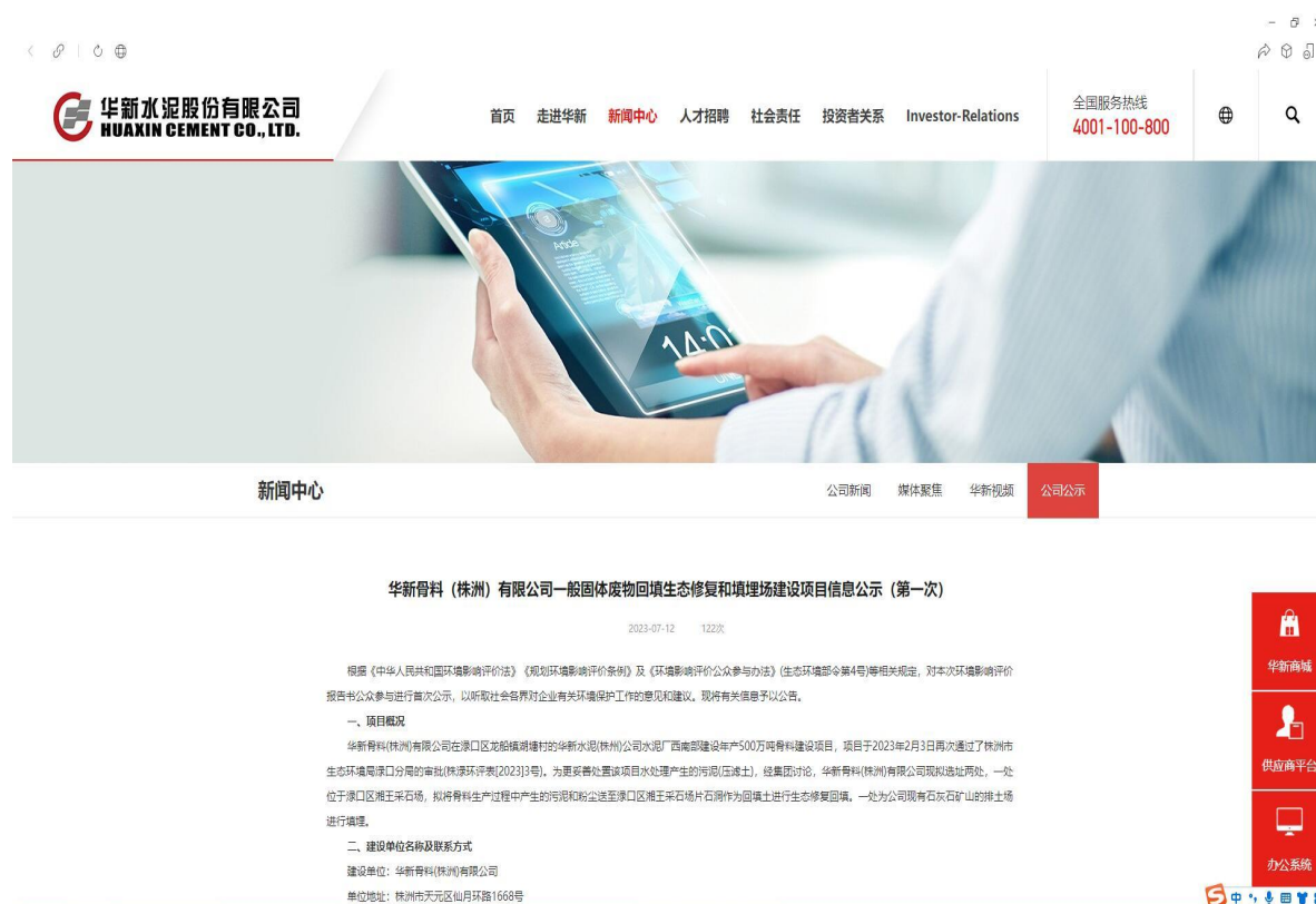
图 2-1 第一次网上公示截图

第一次环境影响评价信息采用网络公示，公示网站为华新水泥股份有限公司，网上公示截图见下图。