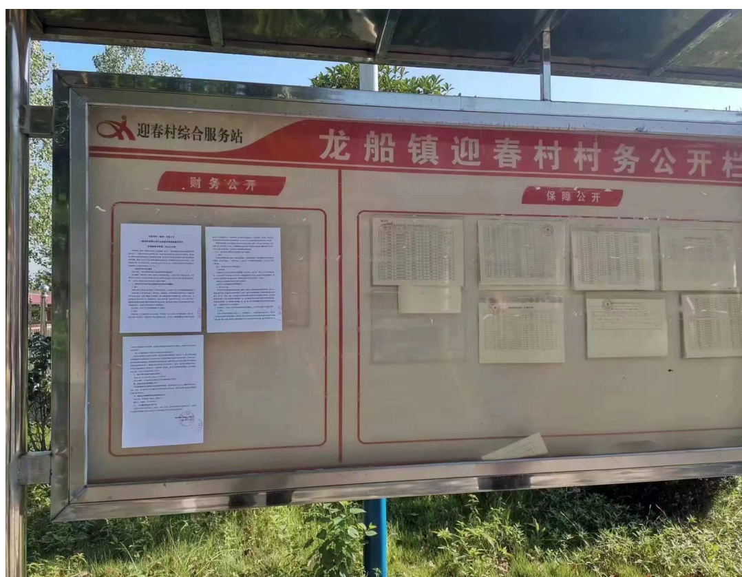
图 3-4 迎春村填埋区张贴公示