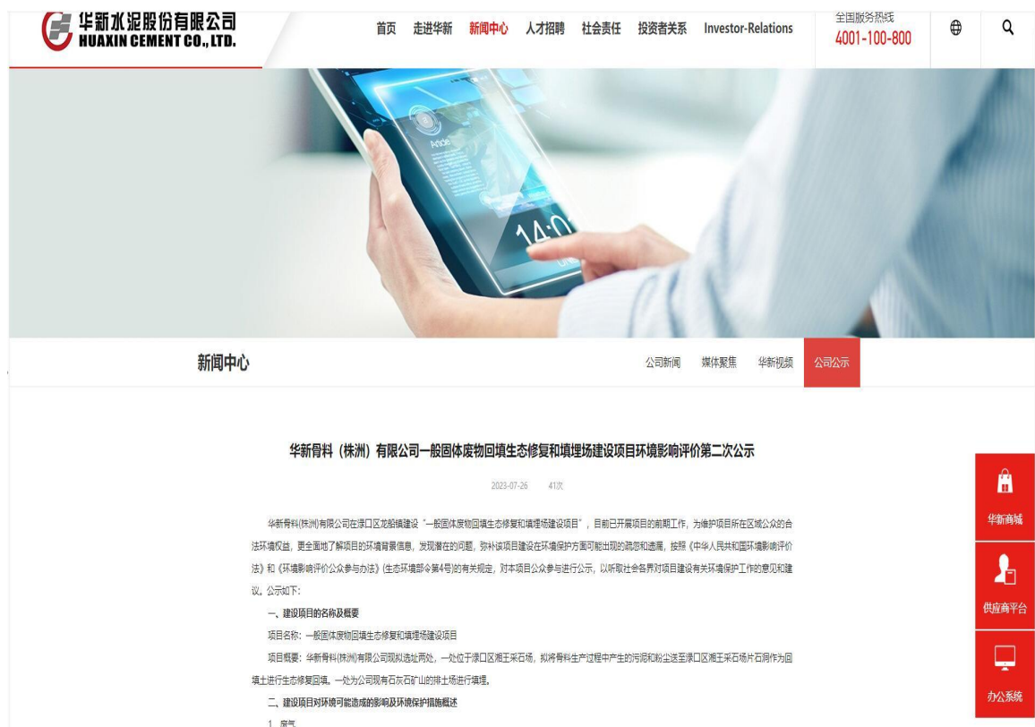
图 3-1 第二次网上公示截图