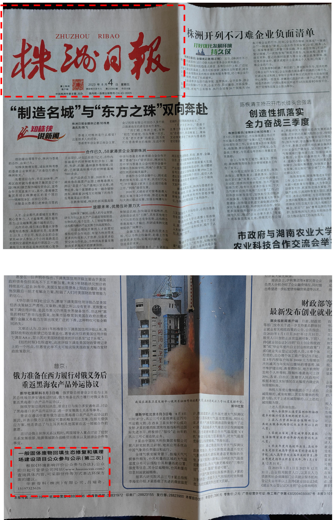
图 3-3 报纸公示 (2023 年 8 月 4 日)