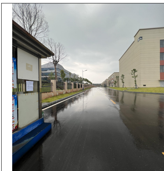
项目所在地公示照片