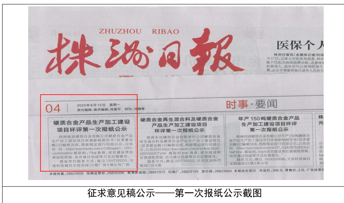
征求意见稿公示——第一次报纸公示截图