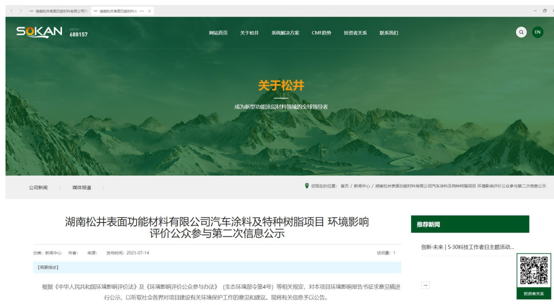
图2 征求意见稿网络公示截图

本公司于2023年7月15日通过网络公示的方式进行了本工程环境影响报告书征求意见稿公示，公示网络媒体为松井集团网站（ http://2108275010.pool203-site.make.yun300.cn/news/290.htm ），持续公开期限为5个工作日，符合《环境影响评价公众参与办法》的要求。