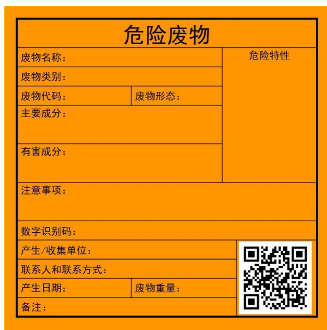
图 4-3 危险废物标签样式示意图

①收集及标识标牌：危险废物其收集、贮存、运输、处置应遵循《中华人民共和国固体废物污染环境防治法》中有关危险废物污染环境防治的相关规定。盛装危险废物的容器上必须符合《危险废物识别标志设置技术规范》(HJ1276-2022)图 8 所示的标签，危险废物标签应以醒目的字样标注：“危险废物”，标签应包含废物名称、废物类别、废物代码、废物形态、危险特性、主要成分、有害成分、注意事项、产生/收集单位名称、联系人、联系方式、产生日期、废物重量和备注。危险废物标签宜设置危险废物数字识别码和二维码。