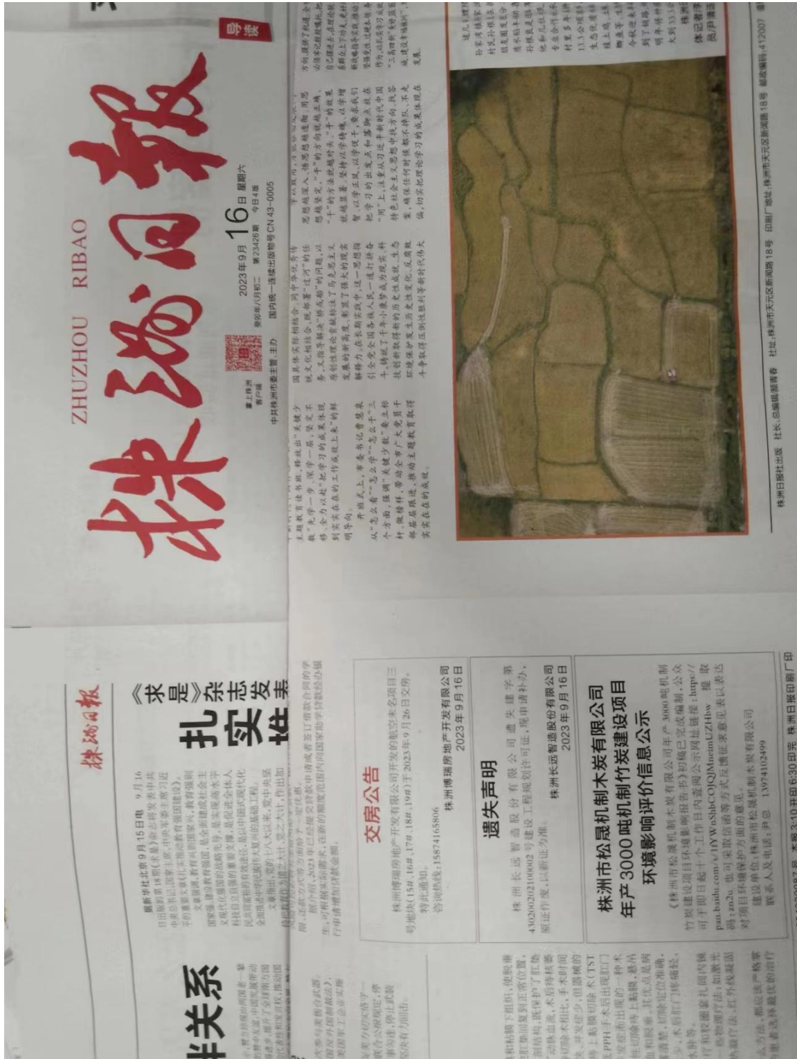
图3 征求意见稿第一次报纸公示