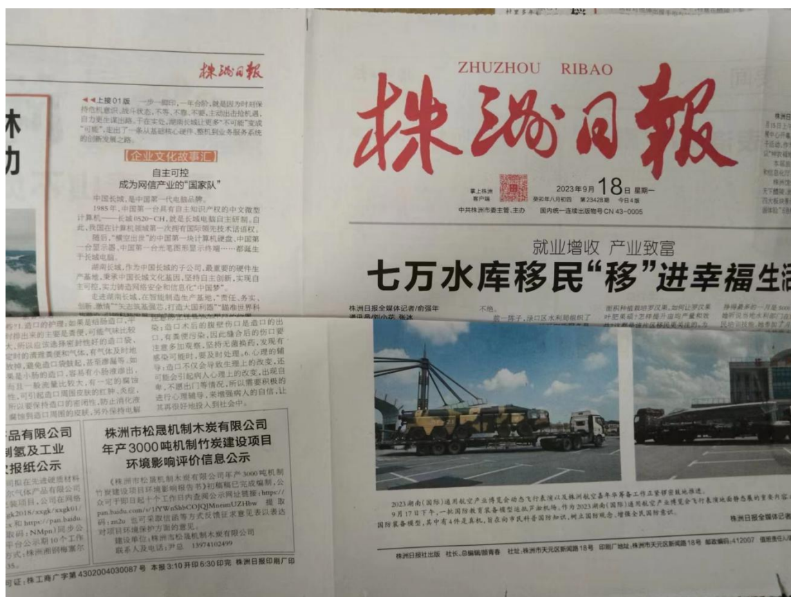
图 4 征求意见稿第二次报纸公示