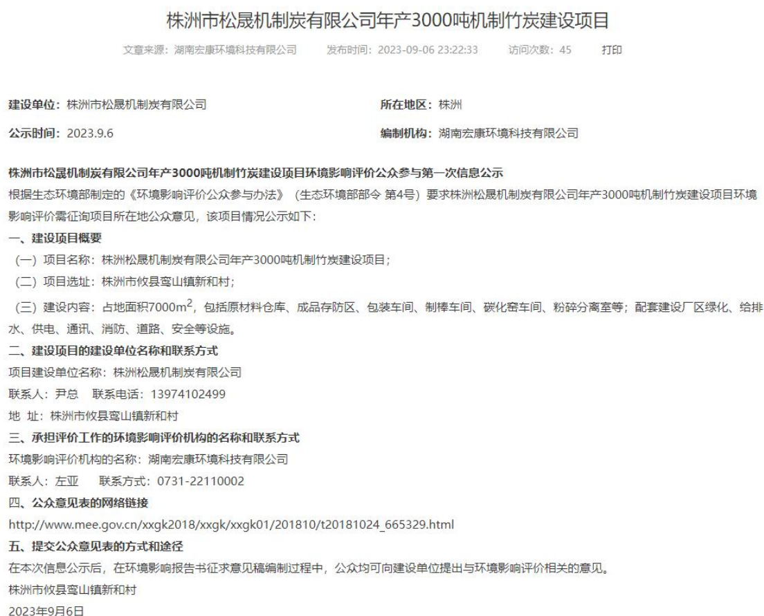
图1 项目首次环境影响评价信息公开公示截图