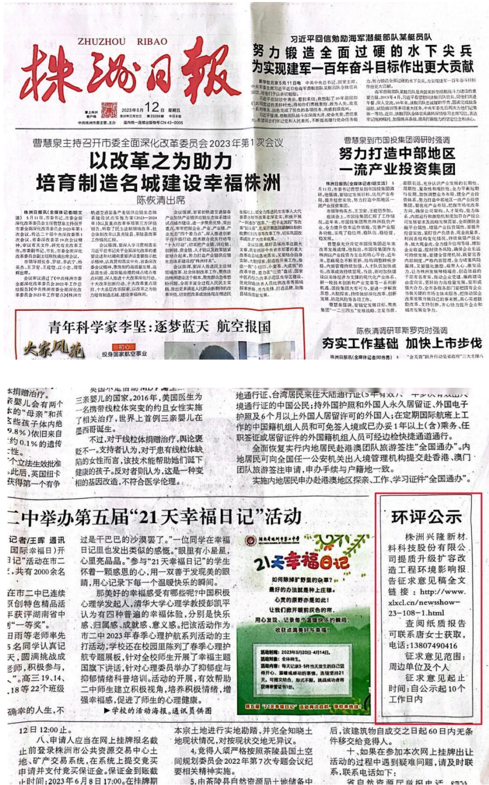
图4 第二次报纸公示照片