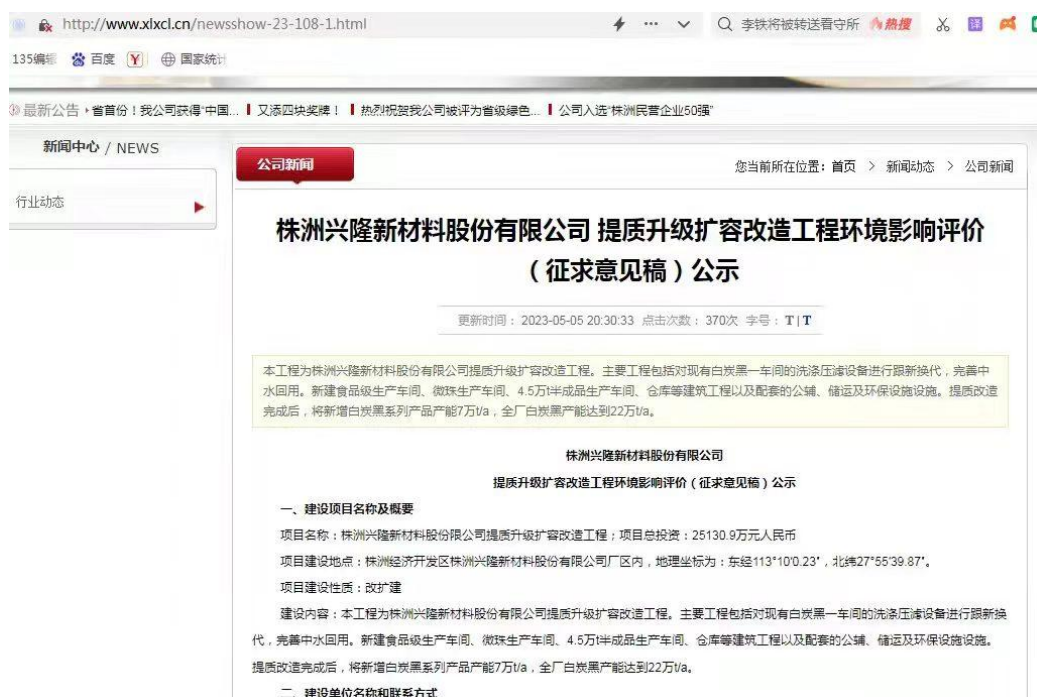
图 2 征求意见稿网络公示截图

本单位于 2023 年 5 月 5 日通过我单位公众网站进行了本工程环境影响报告书征求意见稿公示, 持续公开期限为 10 个工作日, 符合《环境影响评价公众参与办法》的要求。