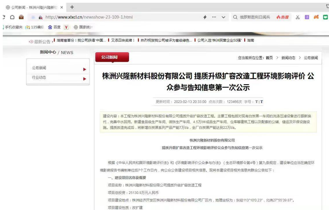
图 1 首次网络公示截图