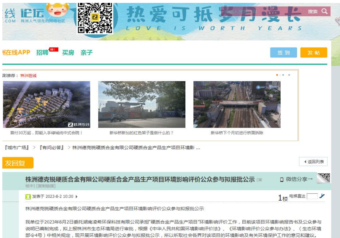
图 7-2 公示信息截图