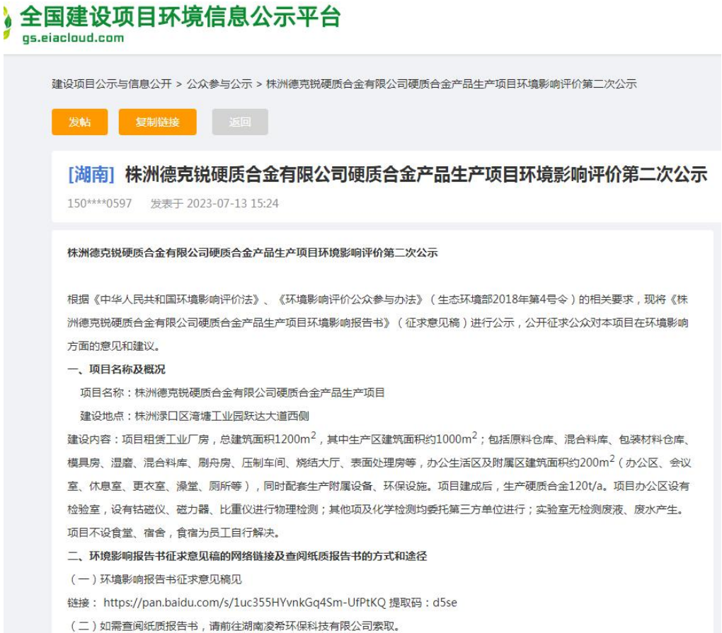
图 3-1 网络公示截图

2023 年 7 月 13 日，我公司在全国建设项目环境影响信息平台（ https://www.eiacloud.com/gs/detail/3?id=30713672TC ）、湖南省环保管家公共服务平台（ https://www.hnhbgj.com/eia/gongshi/6670.html ）、株洲在线论坛进行公示（ https://bbs.zhuzhou.com/forum.php?mod=viewthread&tid=4715524&extra= ）。网站属于专业论坛，具有一定知名度，且环评公示与交流版块分地域公示，能够满足项目环评公示要求。网上公示见图 3-1、图 3-2、图 3-3。