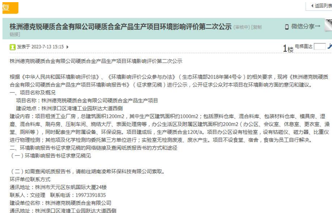
图 3-3 网络公示截图（株洲在线论坛）