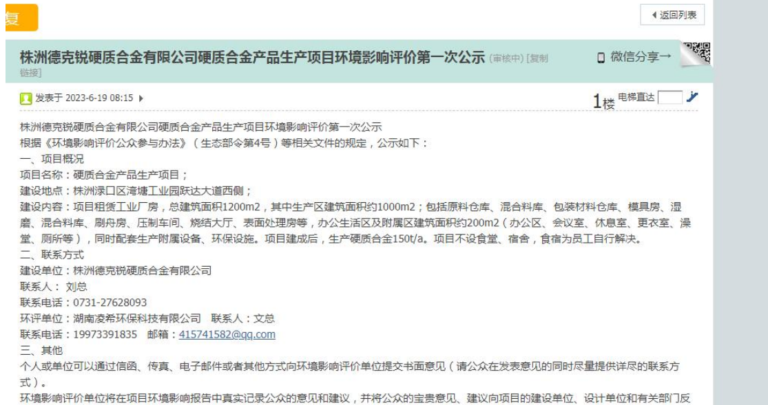
图 2-1 第一次公示（株洲在线论坛）