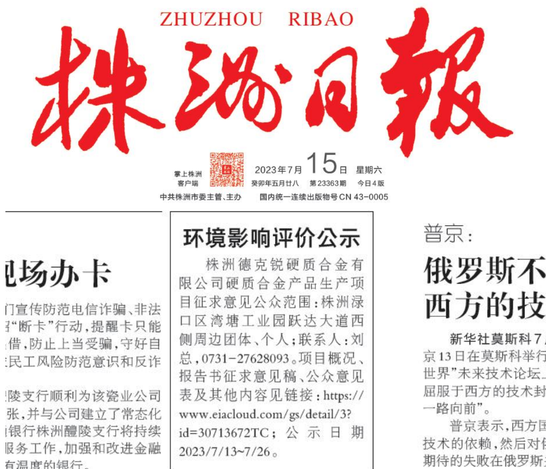
图 3-3 第一次报纸公示截图