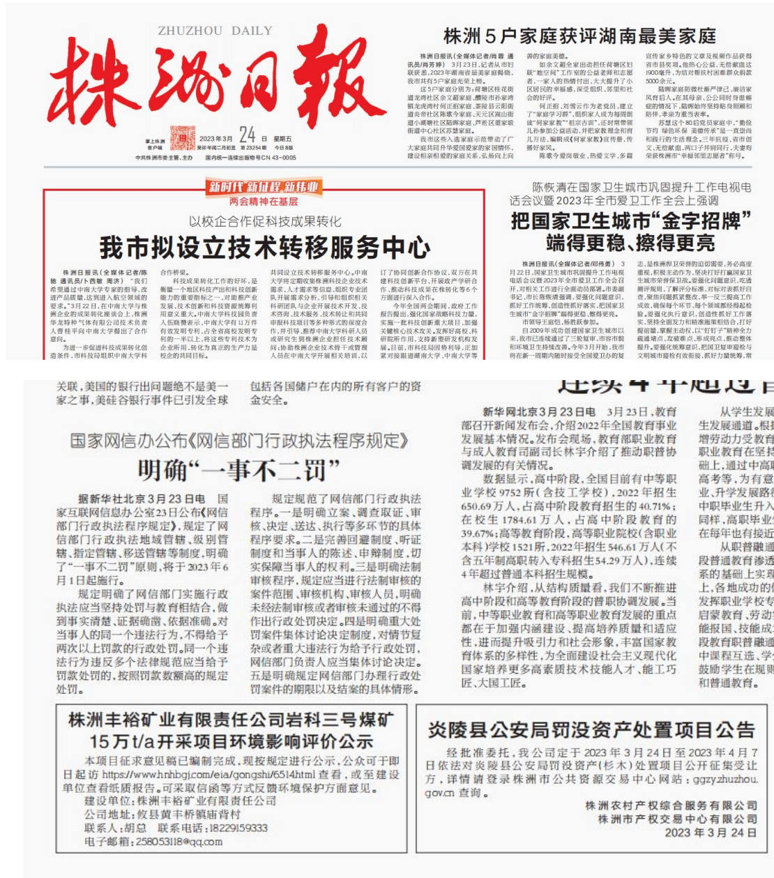
图 3 株洲日报第一次报纸公示照片

本公司于 2023 年 3 月 24 日和 2022 年 3 月 27 日通过报纸公示的方式进行两次了本工程环境影响报告书征求意见稿公示，公示报纸为株洲日报 2023 年 3 月 24 日第 23254 期和 2022 年 3 月 27 日第 23257 期，公示的报纸是项目所在地发行量较大、公众易于接触到的报纸，且在征求意见的 10 个工作日内登报公示了 2 次，符合《环境影响评价公众参与办法》的要求。