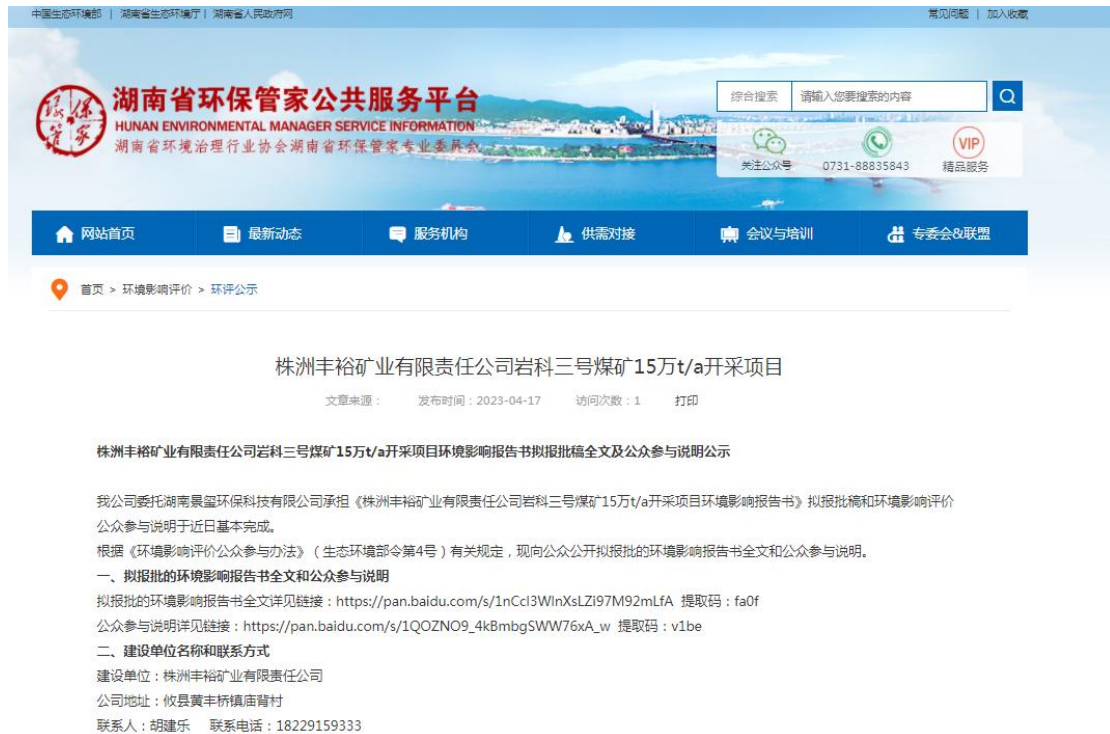
图 6 拟报批稿全文和公众参与说明网络公示截图

公司于 2023 年 4 月 17 日通过网络公示的方式对本工程拟报批的环境影响报告书全文和公众参与说明进行了公示，公示网络媒体为湖南省环保管家公共服务平台网站（ https://www.hnhbgj.com/eia/gongshi/6555.html ），符合《环境影响评价公众参与办法》的要求。