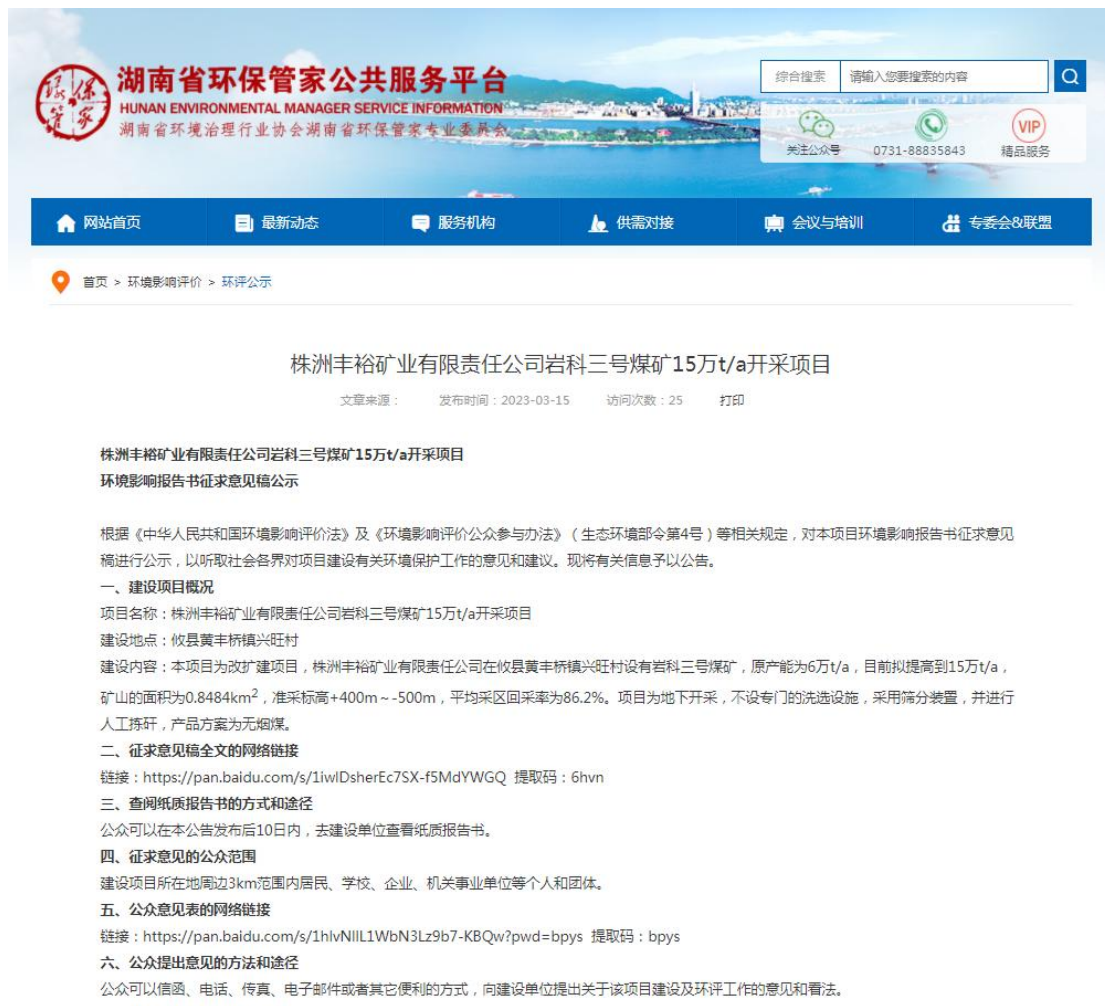
图 2 征求意见稿网络公示截图

本公司于 2023 年 3 月 15 日通过网络公示的方式进行了本工程环境影响报告书征求意见稿公示, 公示网络媒体为湖南省环保管家公共服务平台( https://www.hnhbgj.com/eia/gongshi/6514.html ), 持续公开期限为 10 个工作日, 符合《环境影响评价公众参与办法》的要求。