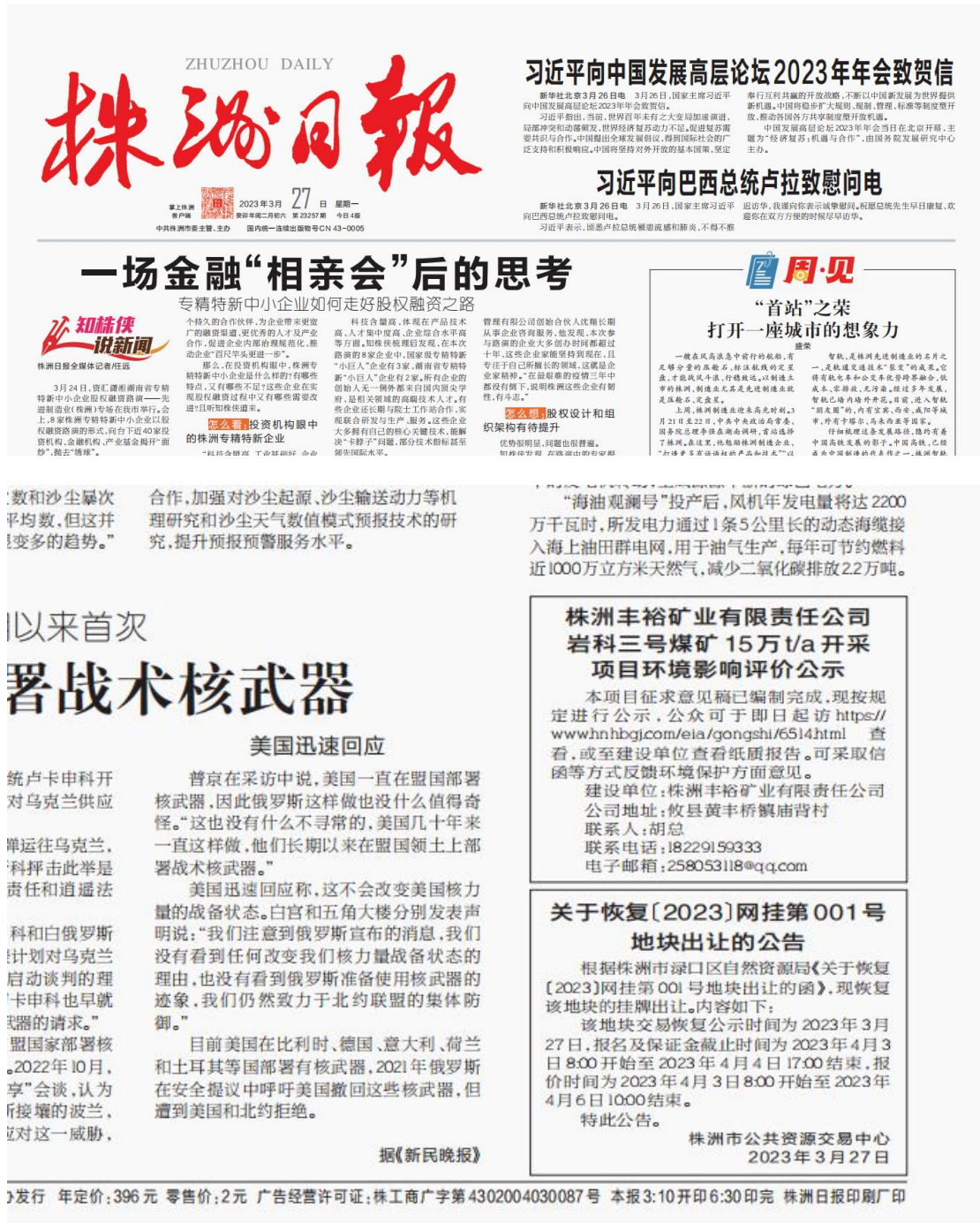
图 4 株州日报第二次报纸公示照片