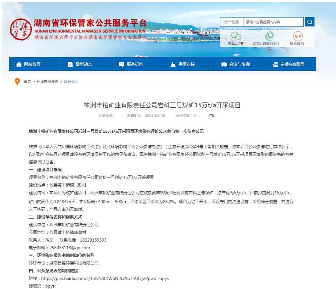
图 1 首次网络公示截图