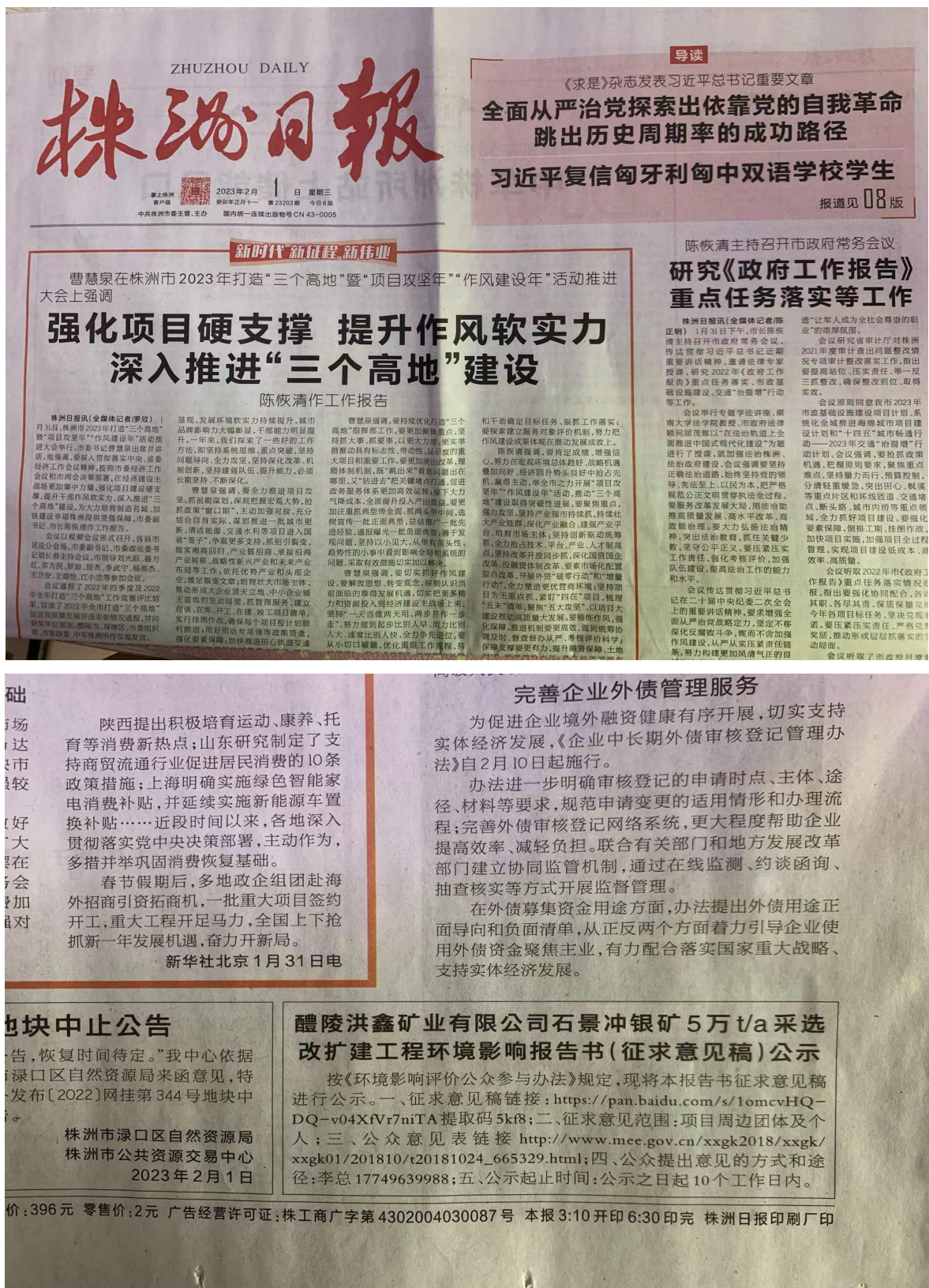
图 3.2-3 报纸公示截图（第二次）