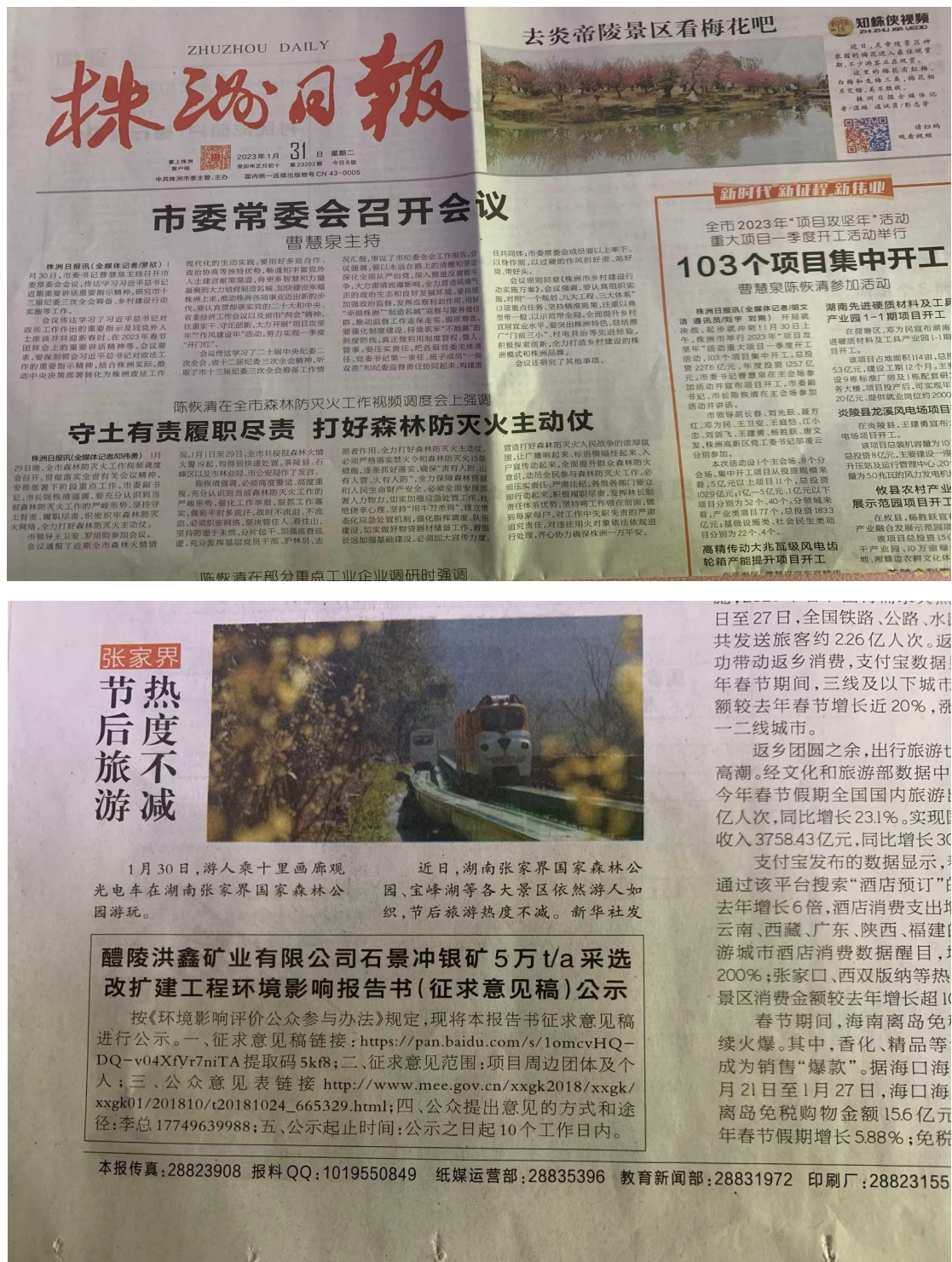
图 3.2-2 报纸公示截图（第一次）