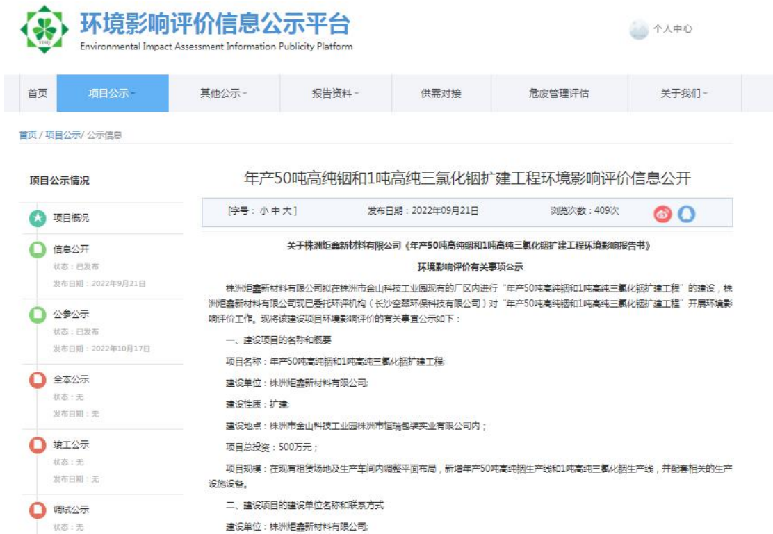
图2 项目网上一次公示截图

我公司于2022年10月17日将本工程建设环境影响评价征求意见稿，在环境影响评价信息公示平台（网址为 http://www.js-eia.cn/project/detail?type=2&proid=a7fb308dd78bd76a263859fa73f70a5c ）上发布了本项目的网上公示，详见图2，发布的主要内容包括：工程内容，环境现状、环保措施等。