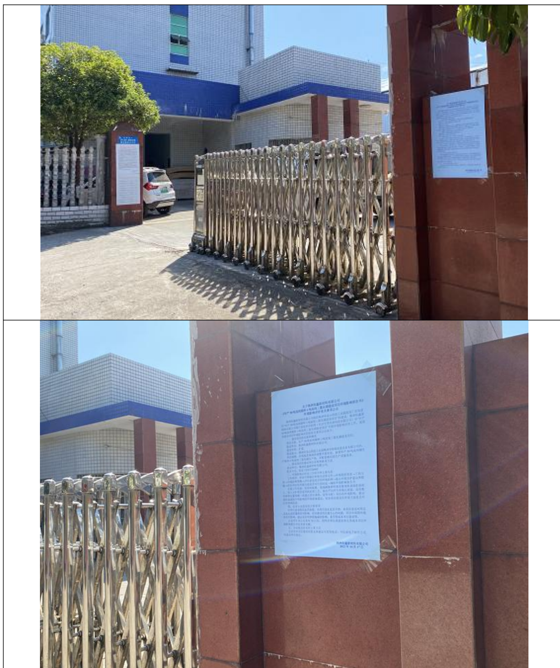
图 1 项目公示照片