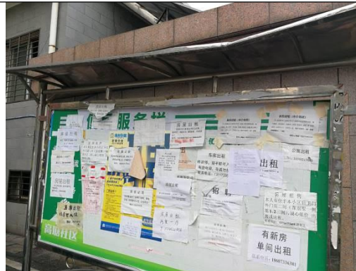
高塘安置小区公示照片