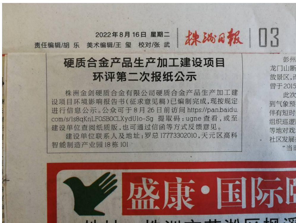
征求意见稿公示——第二次报纸公示截图