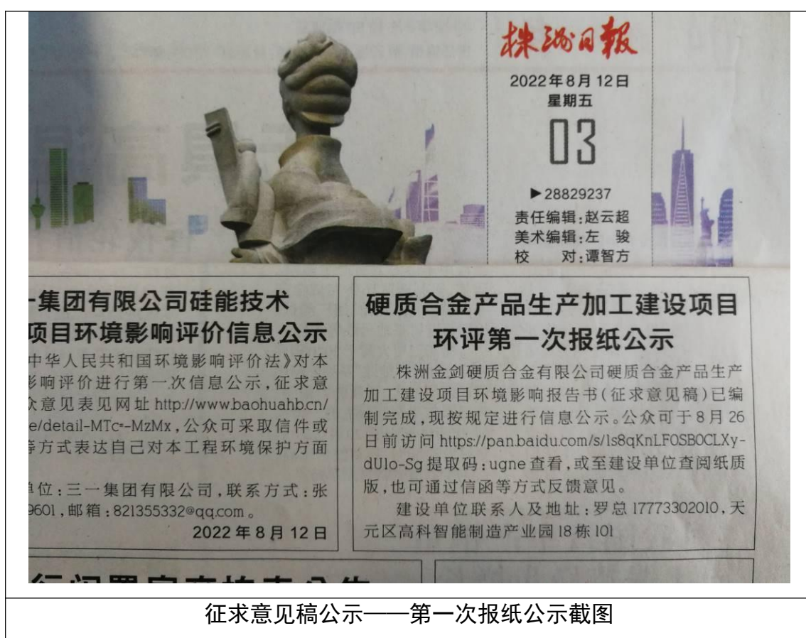
征求意见稿公示——第一次报纸公示截图