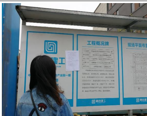
项目所在地公示照片