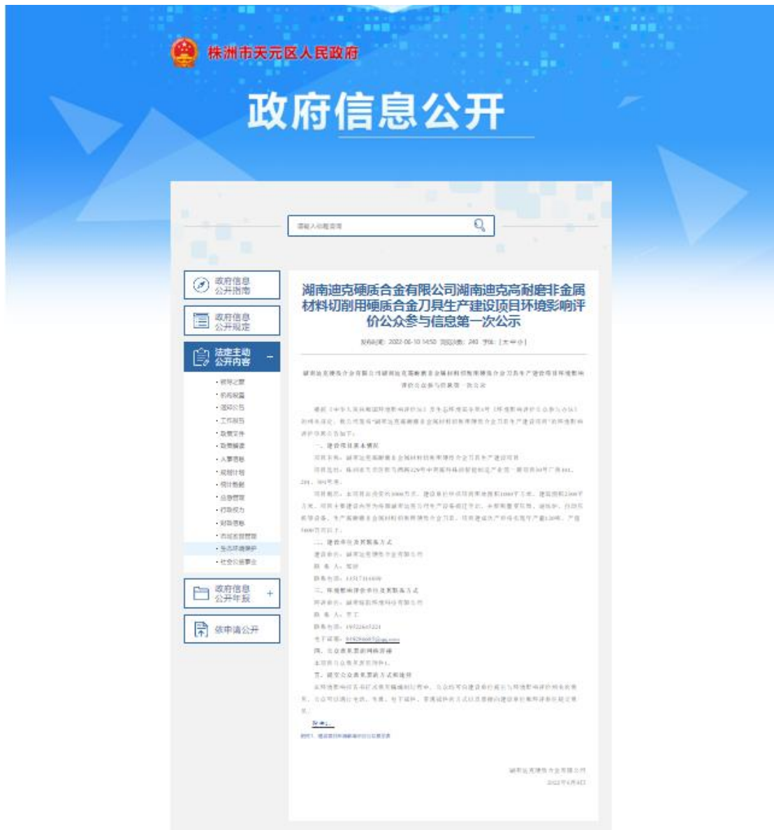
图 1 本项目第一次公示截图

我单位于 2022 年 6 月 6 日委托湖南绿韵环境科技有限公司为本工程的环境影响报告书编制单位,我单位于 2022 年 6 月 10 日在株洲市天元区人民政府网站,按照《环境影响评价公众参与办法》第九条中的五项要求分布了信息公示。公示时间、网站和内容符合《环境影响评价公众参与办法》第九条的要求。