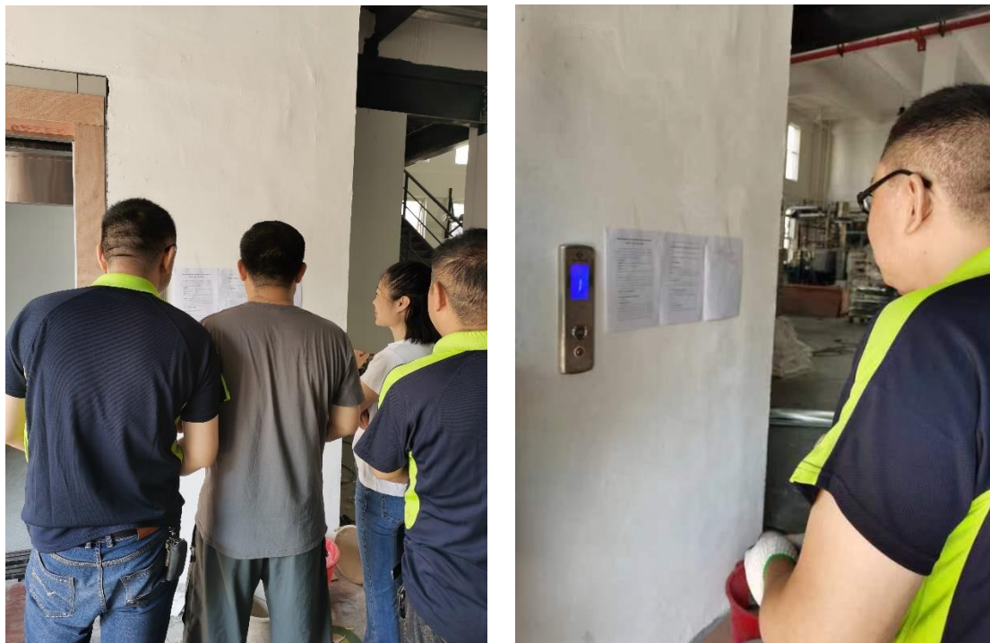
图 5 项目周边现场公示图片