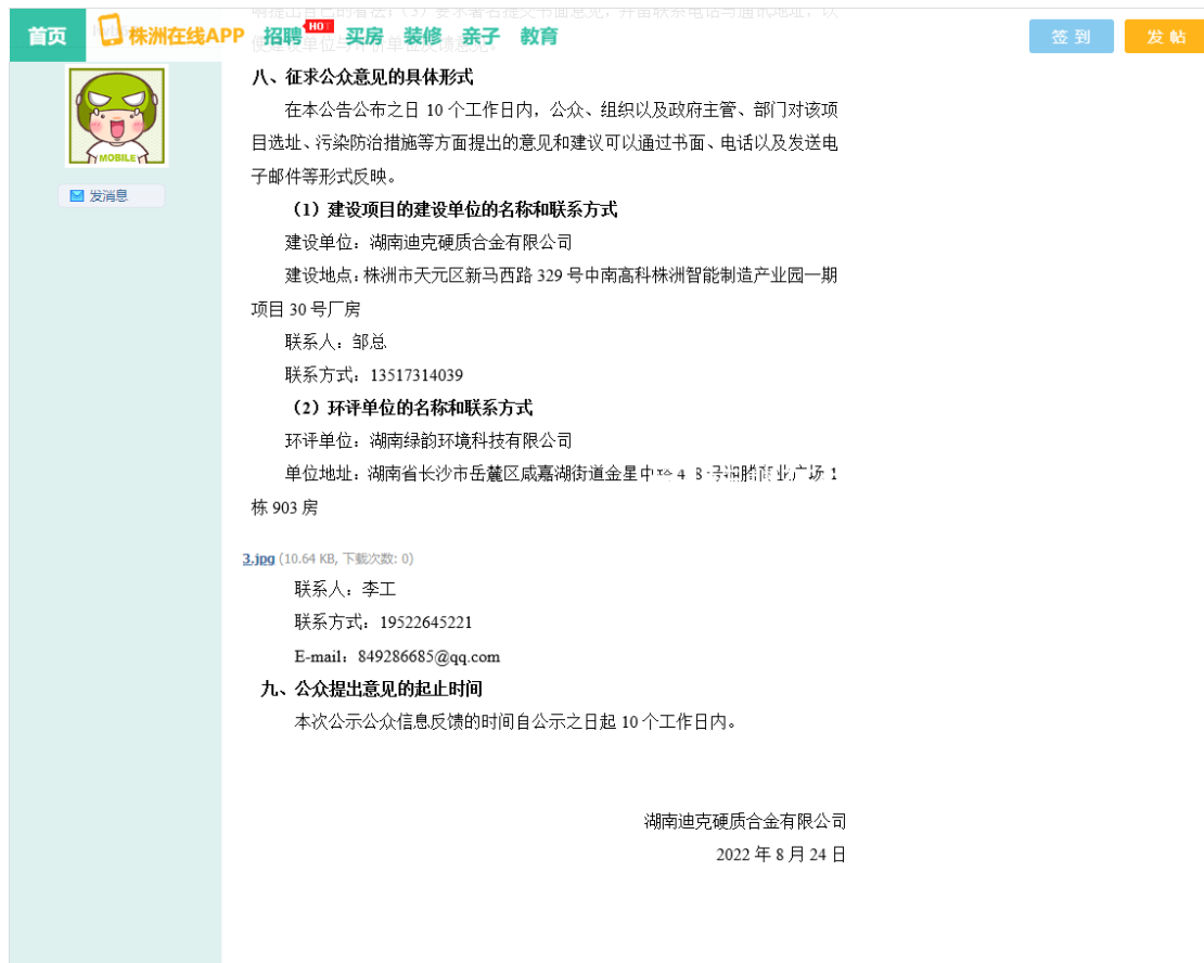
图 2 本项目环境影响评价第二次公开