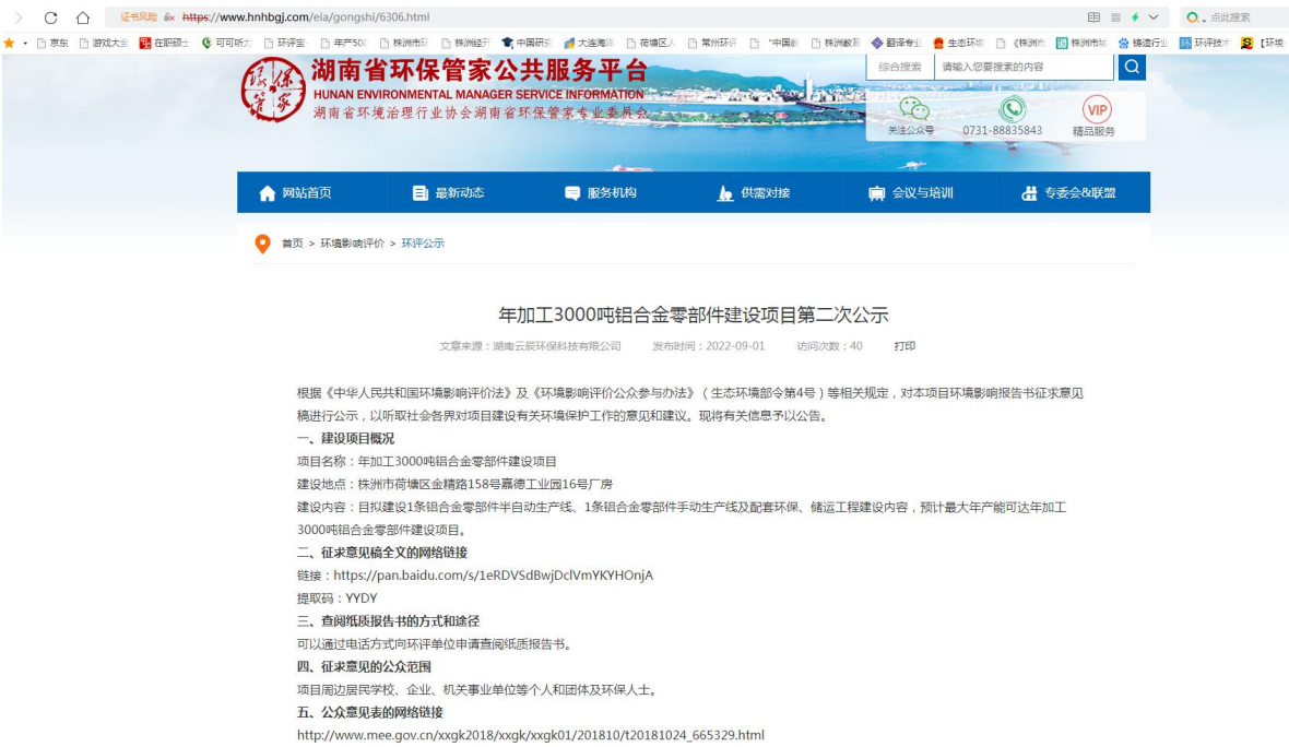
图 2 征求意见稿网络公示截图