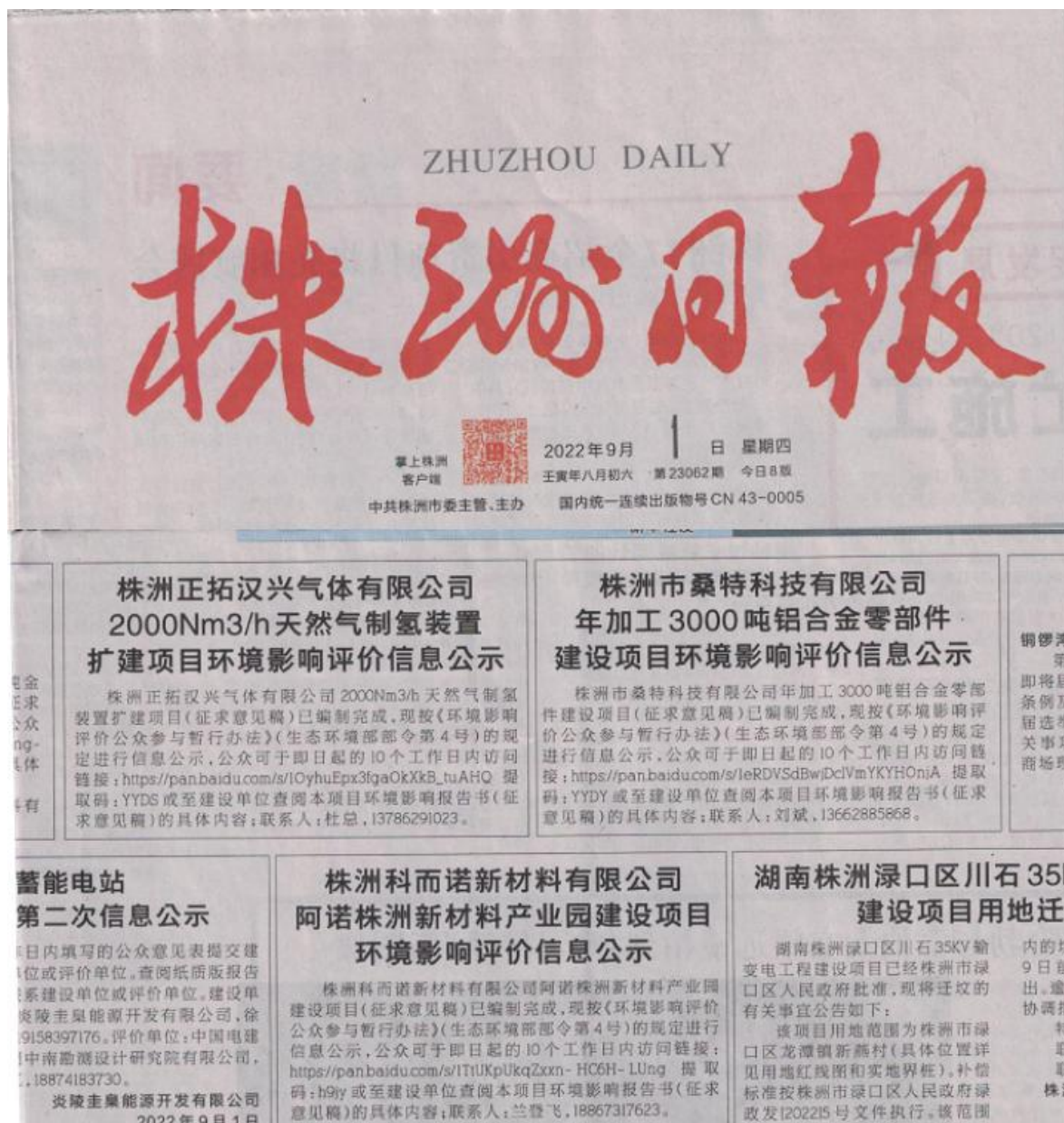
图3 第一次报纸公示照片