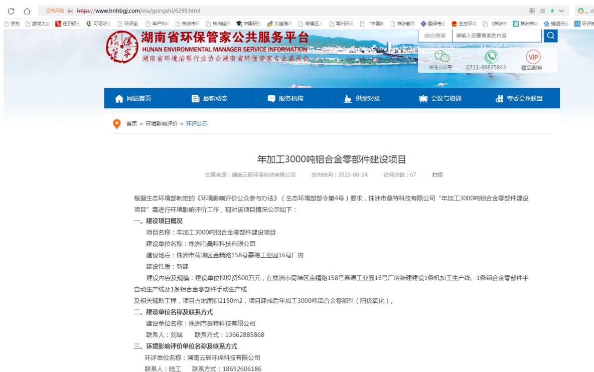
图1 首次网络公示截图

第一次网络公示期间, 环评单位和建设单位均未接到项目周边居民以邮件、电话、信息及邮寄的公参调查表等方式反馈的意见, 周边居民无意见反馈。