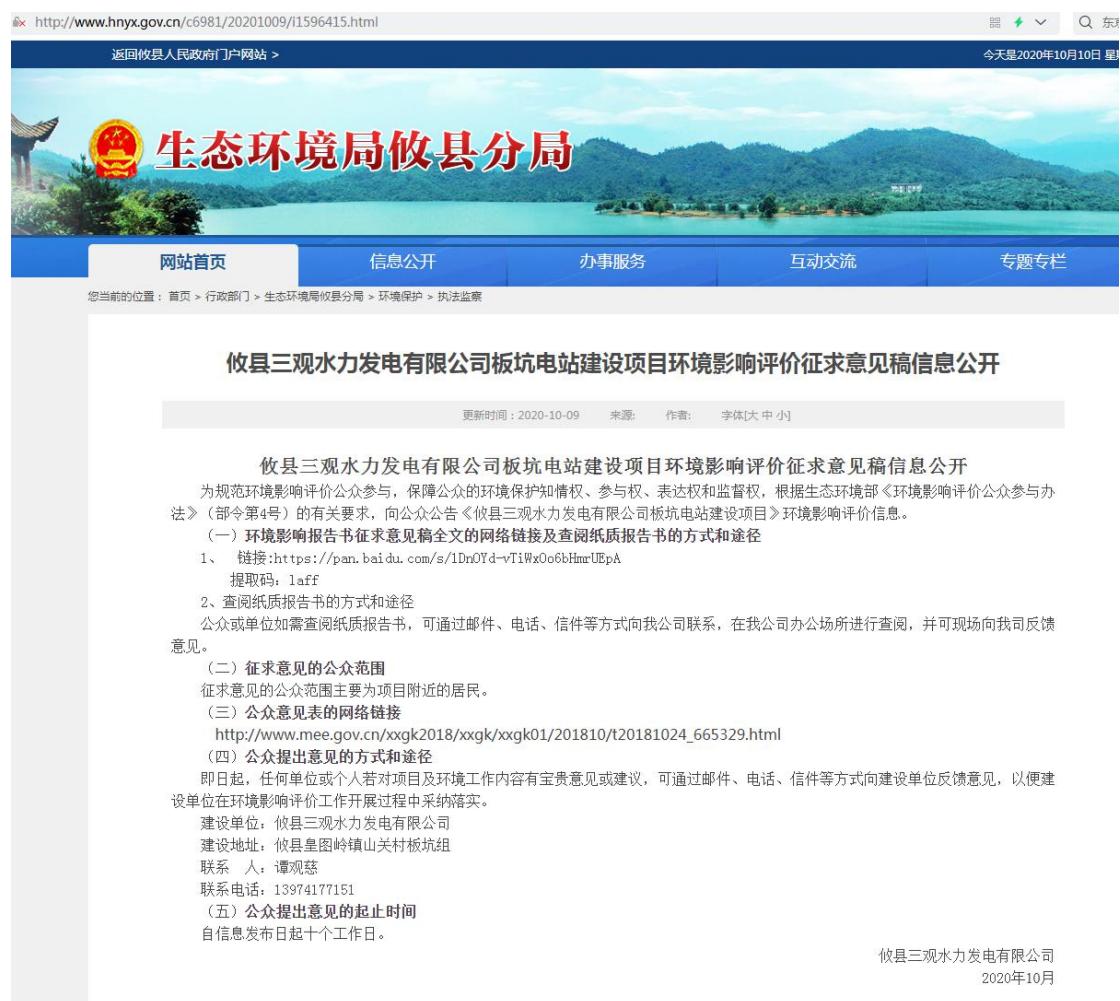
图 2 网上第二次公示截图