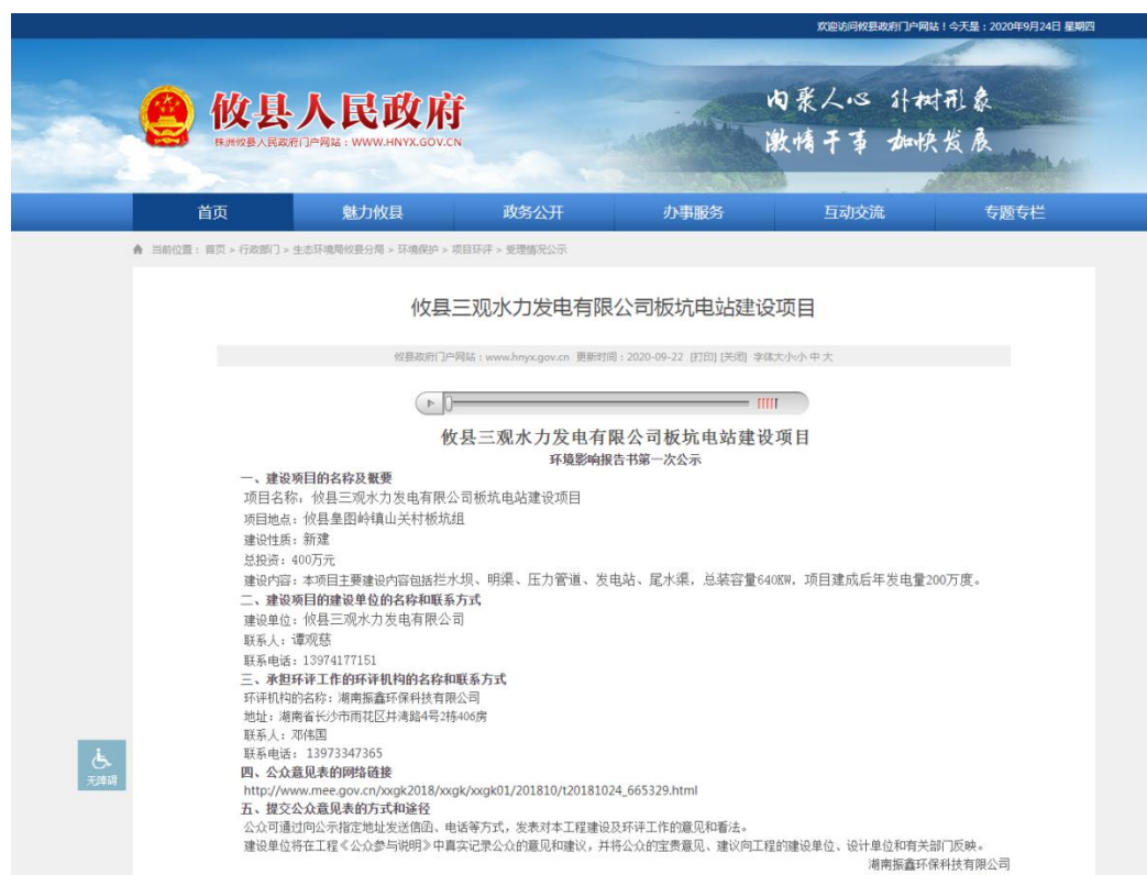
图1 网上第一次公示截图