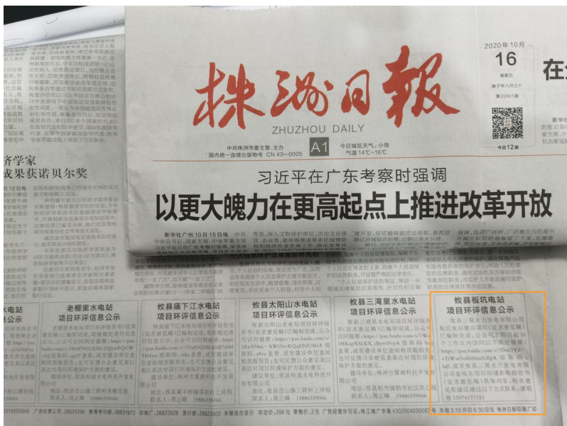
图5 报纸第一次公示截图