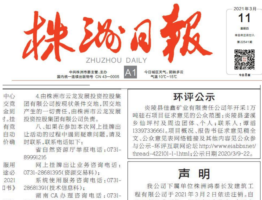
图 3-3 第一次报纸公示截图

我公司于 2021 年 3 月 11 日和 3 月 13 日，在株洲日报上进行了公示；株洲日报创刊于 1957 年 10 月 1 日，是中共株洲市委的机关报，是广大读者了解株洲、了解全国、了解世界的重要传播媒体，选取该报纸公示可行；报纸公示照片见图 3-3、图 3-4。