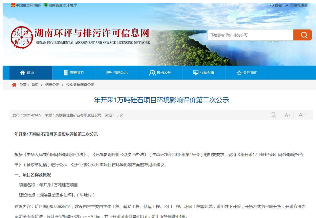
图 3-2 网络公示截图