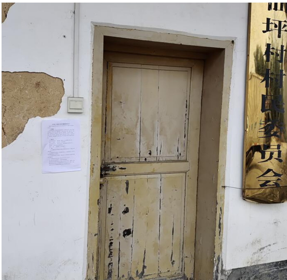
图 3-4 现场公示照片