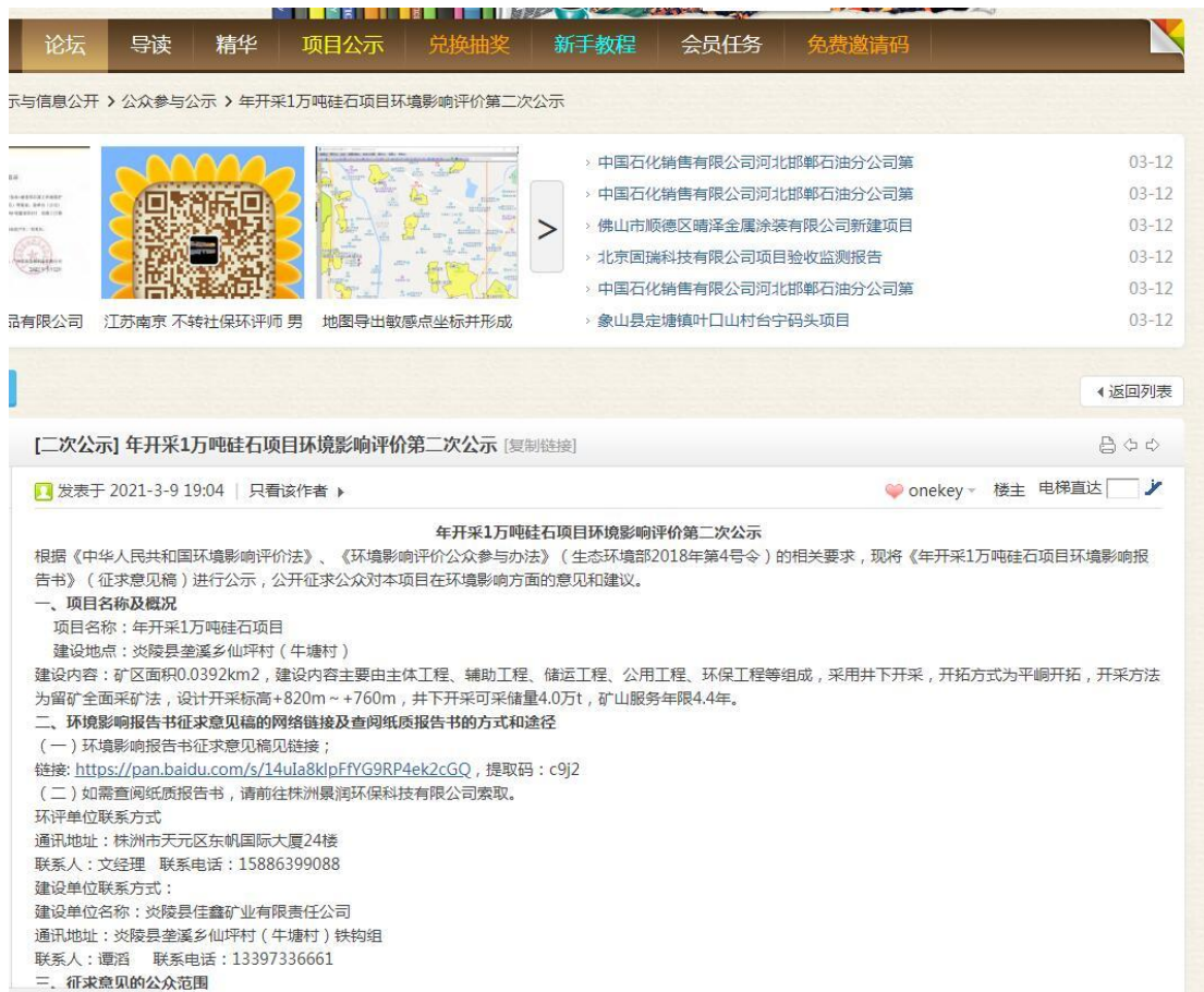
图 3-1 网络公示截图