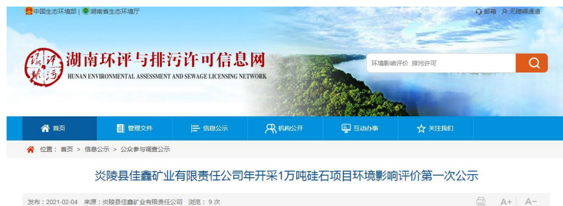
图 2-2 第一次公示（湖南环评与排污许可信息网）