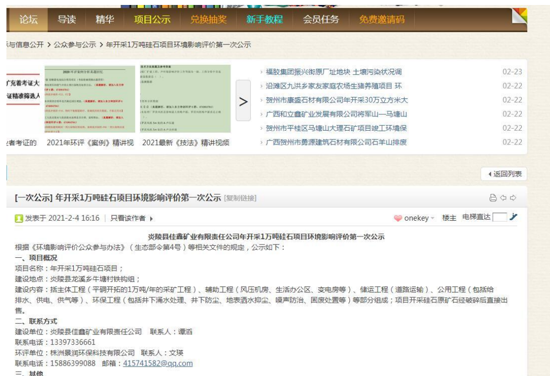
图 2-1 第一次公示（环评互联网）