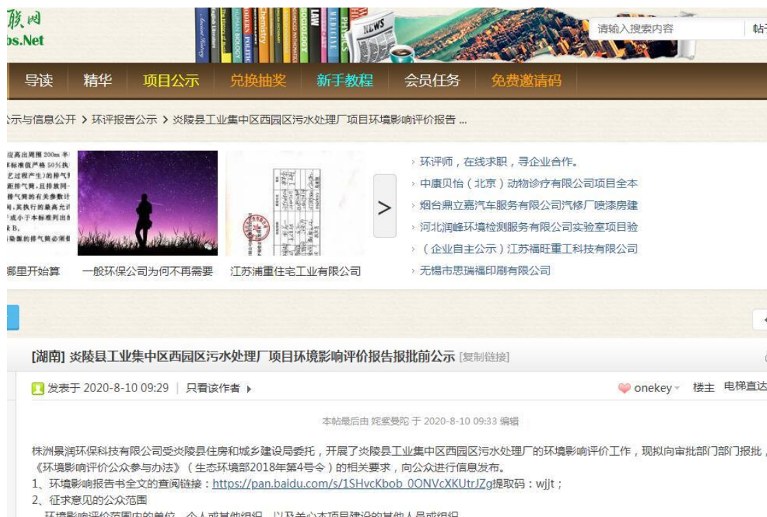
图 6-1 报批公示截图