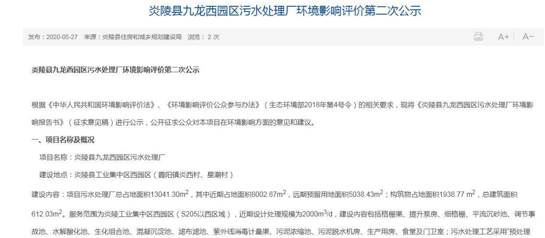
图 3-2 网络公示截图