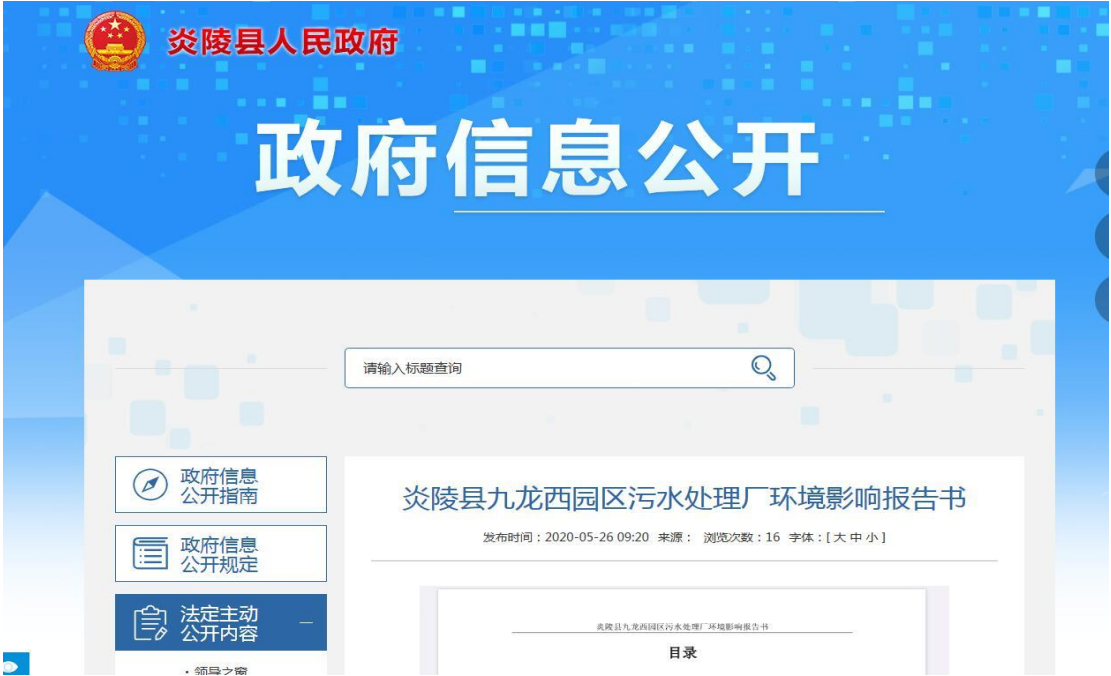
图 3-1 网络公示截图

许可信息网(炎陵县九龙西园区污水处理厂环境影响评价第二次公示 | 湖南公众参与调查公示平台 https://www.hnhppw.com/gongshi/4/868.html ) 进行网上公示; 网上公示见图 3-1、图 3-2。)