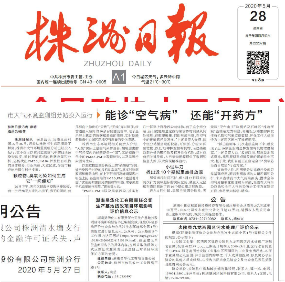
图 3-3 第一次报纸公示截图

我单位于2020年5月28日和5月30日，在株洲日报上进行了公示；株洲日报创刊于1957年10月1日，是中共株洲市委的机关报，是广大读者了解株洲、了解全国、了解世界的重要传播媒体，选取该报纸公示可行；报纸公示照片见图3-3、图3-4。