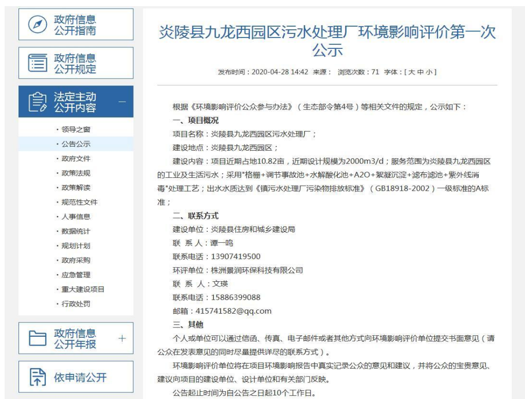
图 2-1 第一次公示