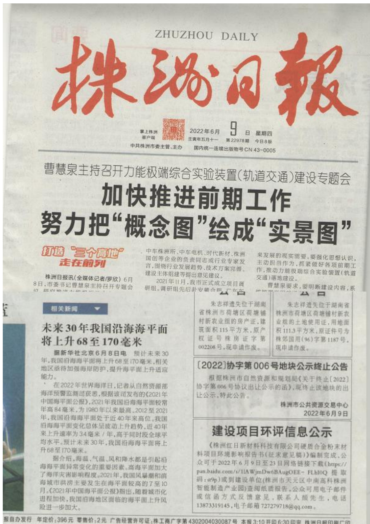
图3 环评信息《株洲日报》2022年6月9日首次公示