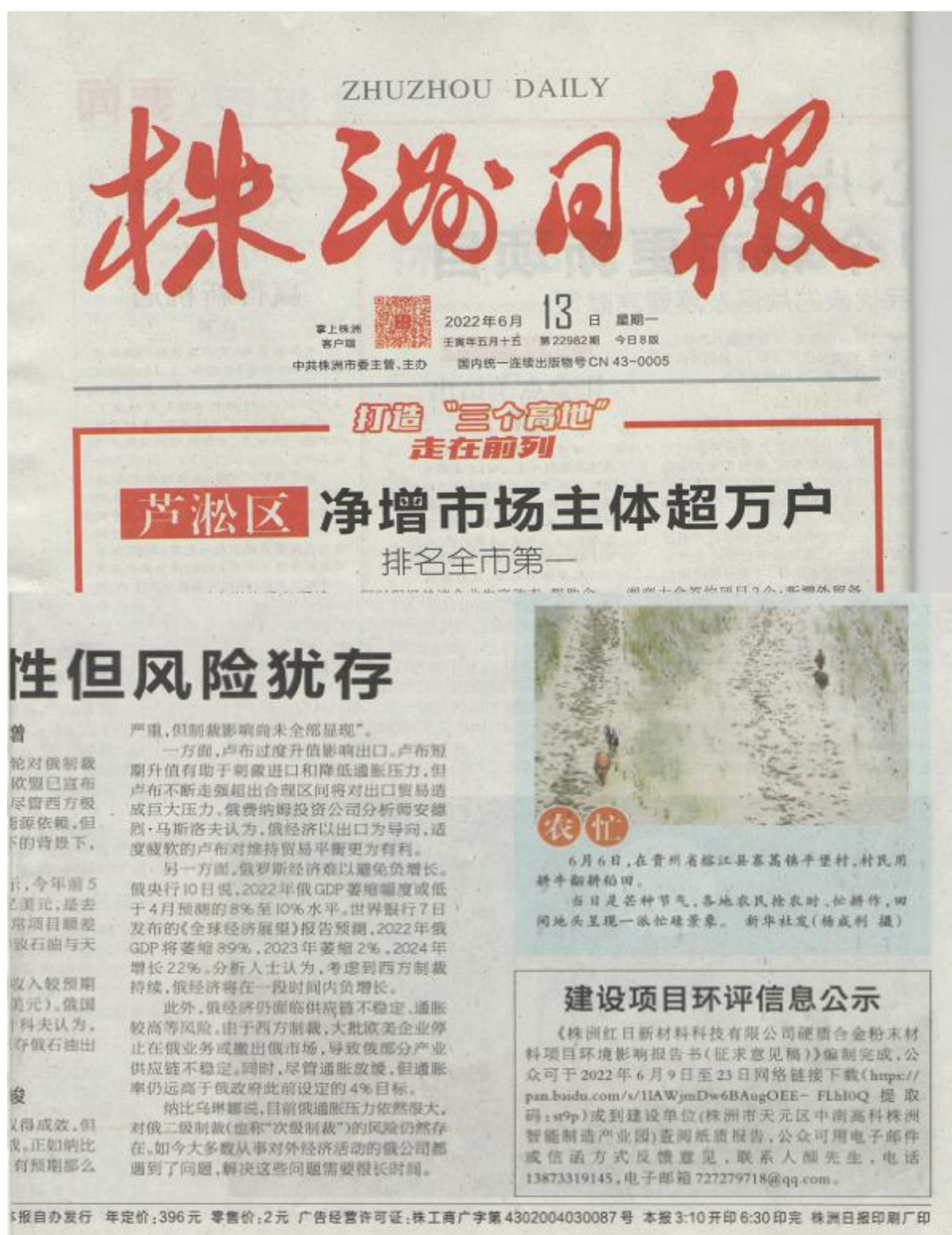
图 4 环评信息《株洲日报》2022 年 6 月 13 日第二次公示