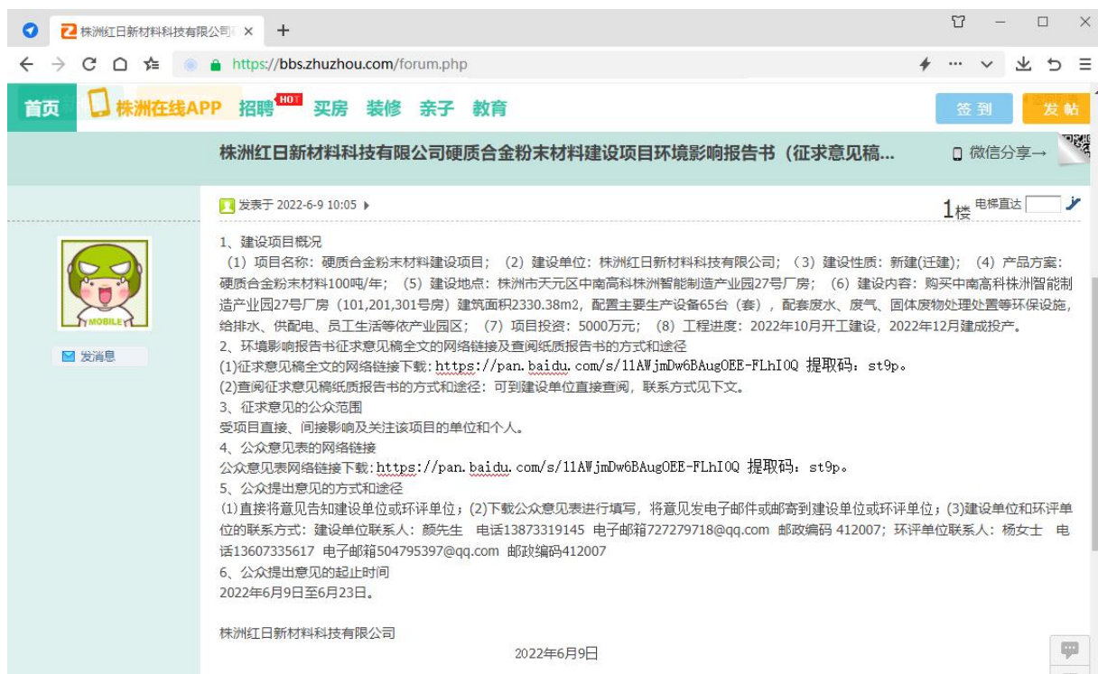
图 2 环境影响评价信息网络第二公示