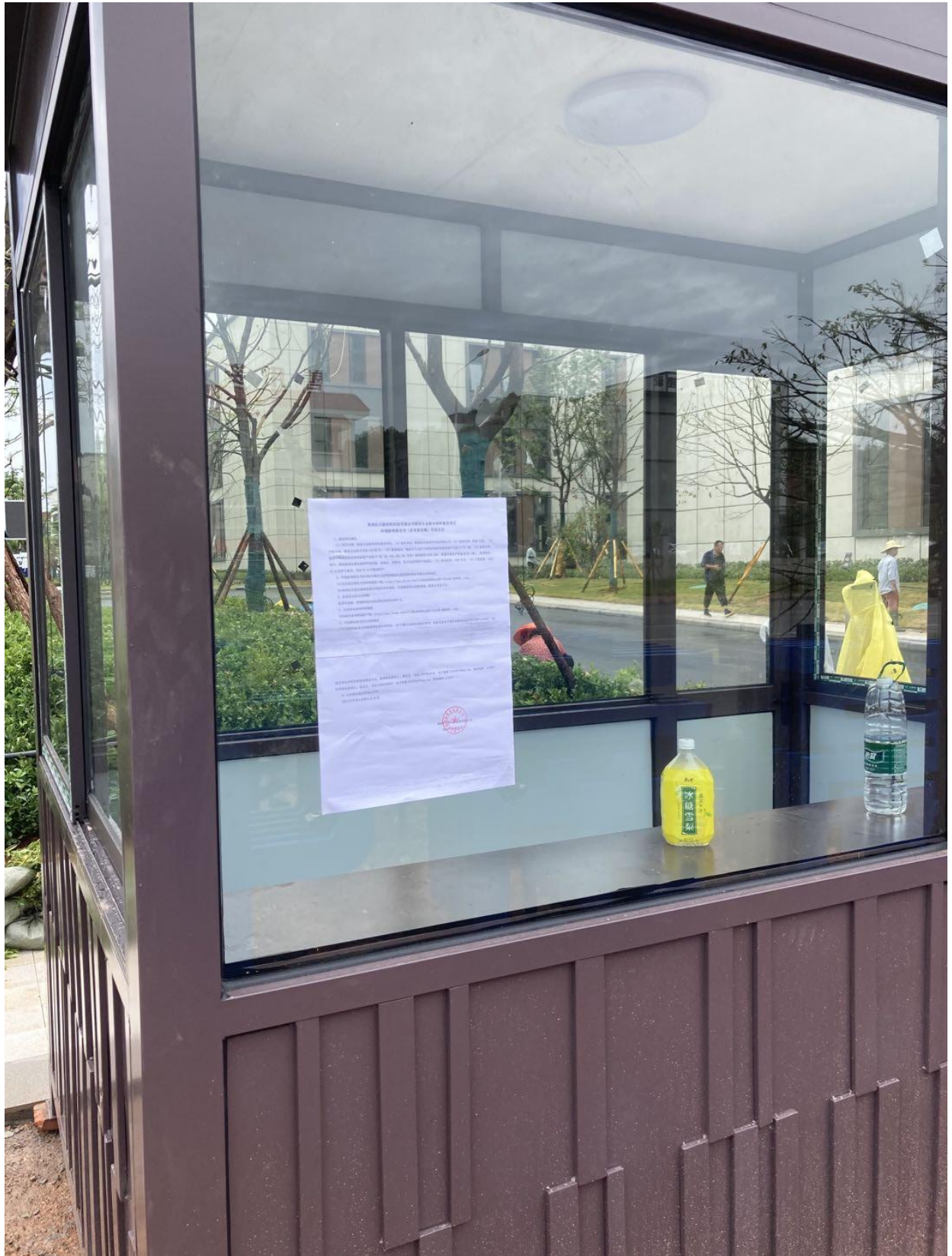
图 5 环境影响评价信息现场张贴公示(中南高科株洲智能制造产业园入口)