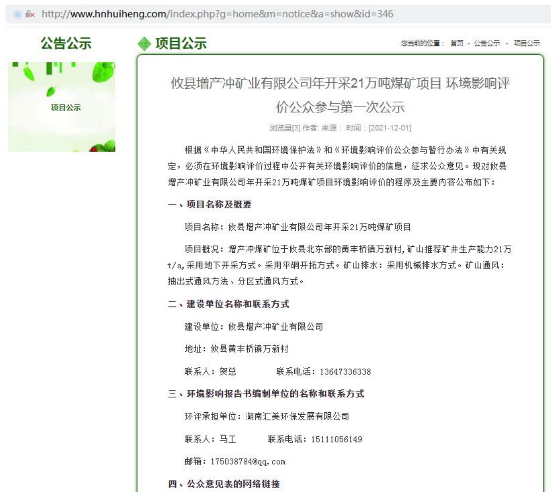
图 1 第一次网络公示截图

http://www.hnhuiheng.com/index.php?g=home&m=notice&a=show&id=346 。