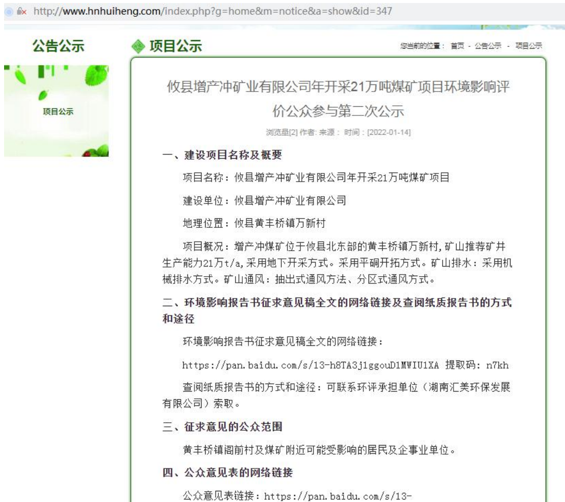
图 2 征求意见稿网络公示截图

http://www.hnhuiheng.com/index.php?g=home&m=notice&a=show&id=347 。