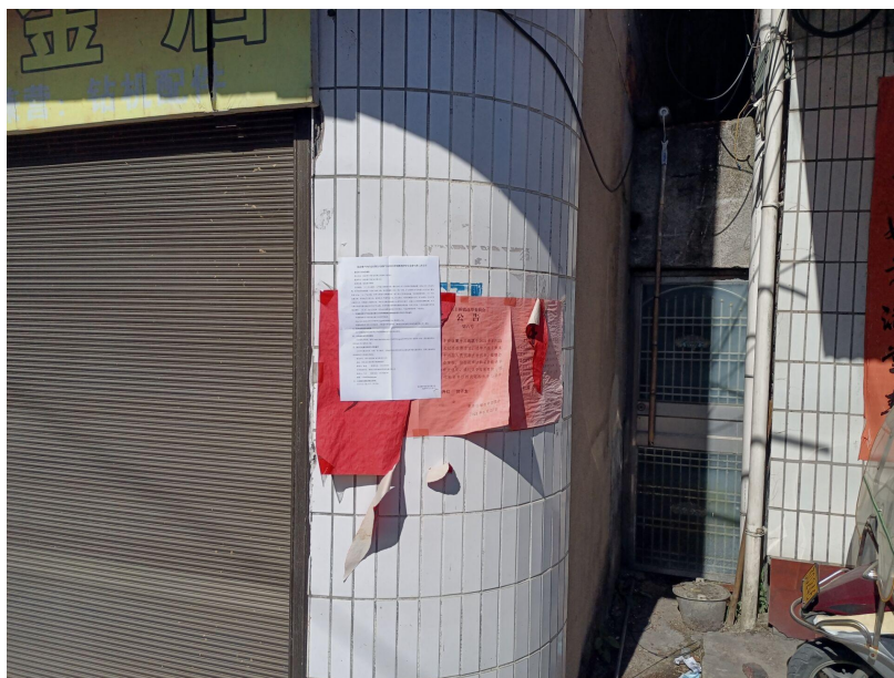
图 4 现场公示照片

我单位于 2022 年 1 月 14 日通过现场公示的方式，在黄丰桥镇塔前村以张贴公告的形式进行了本项目征求意见稿公示，选取的张贴地点涵盖了本项目可能受影响的区域，持续公示期限为 10 个工作日，符合《环境影响评价公众参与办法》的要求。