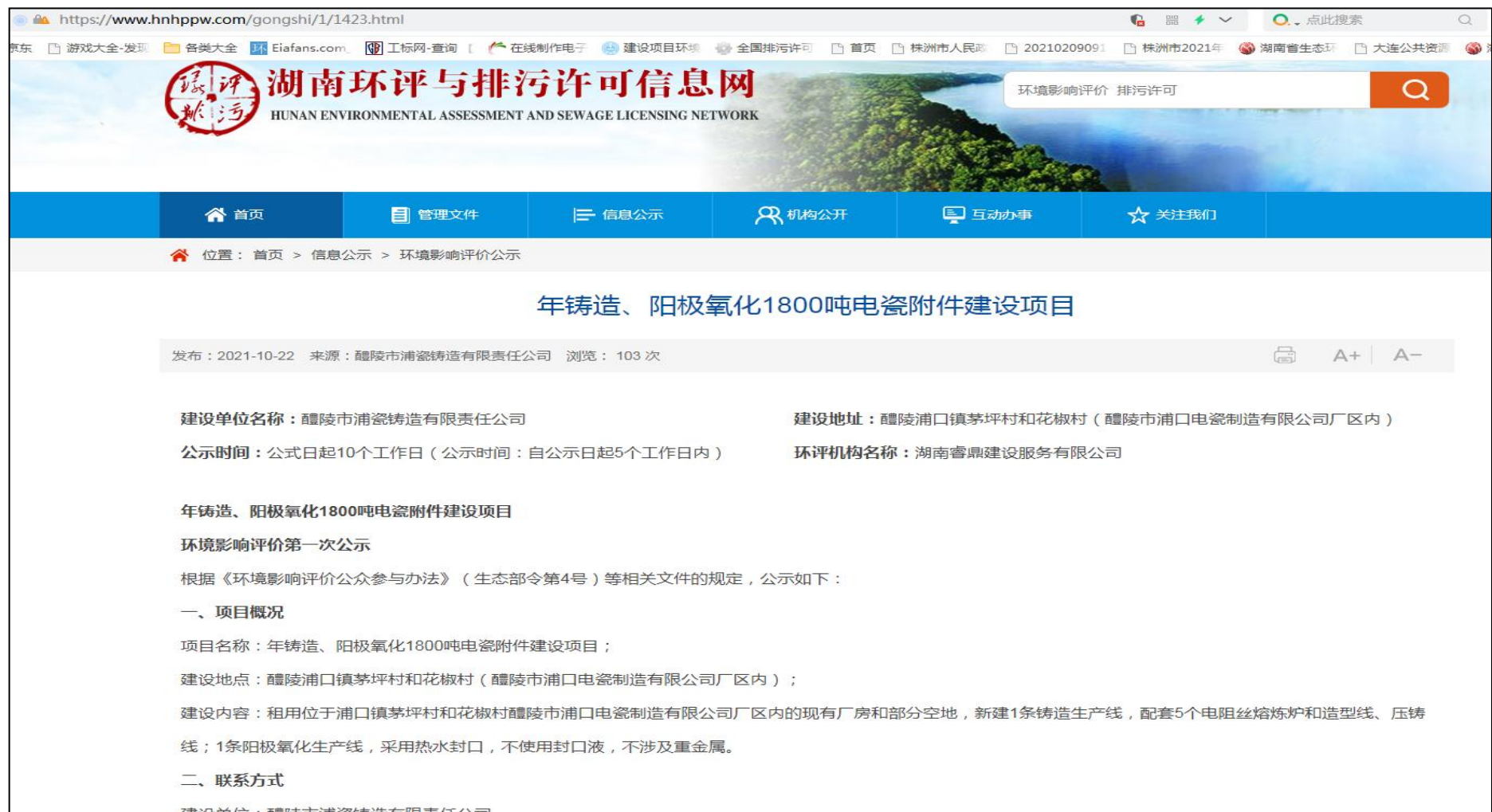
图 2-1 一次公示网络公示截图