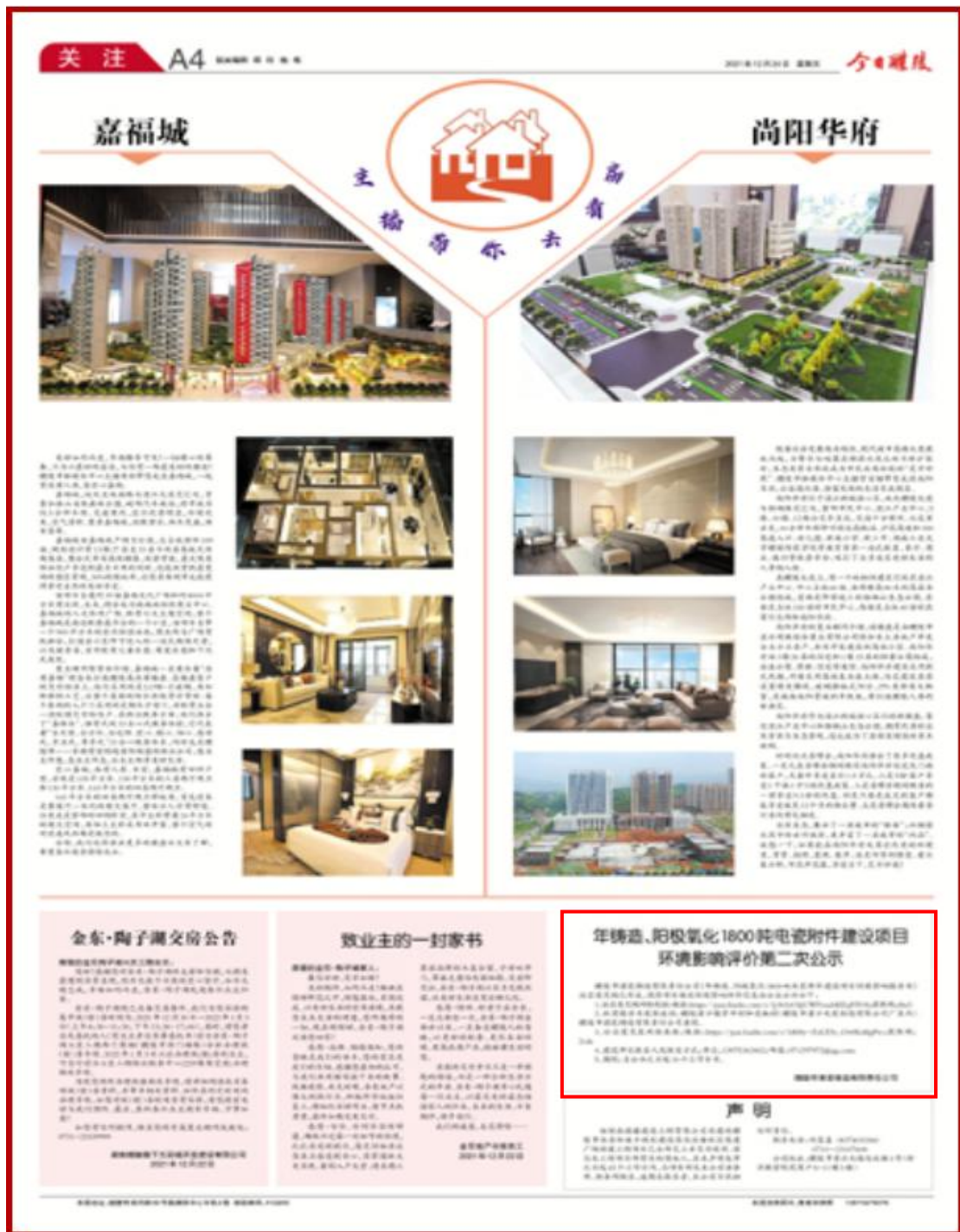
图 3-3 报纸公示截图（2）