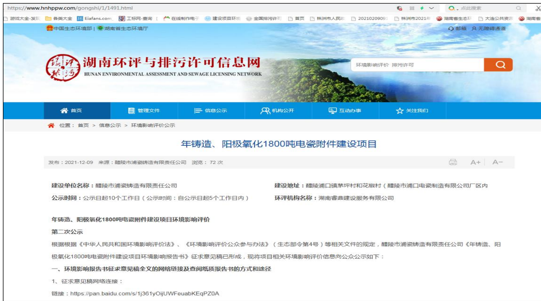
图 3-1 二次公示网络公示截图