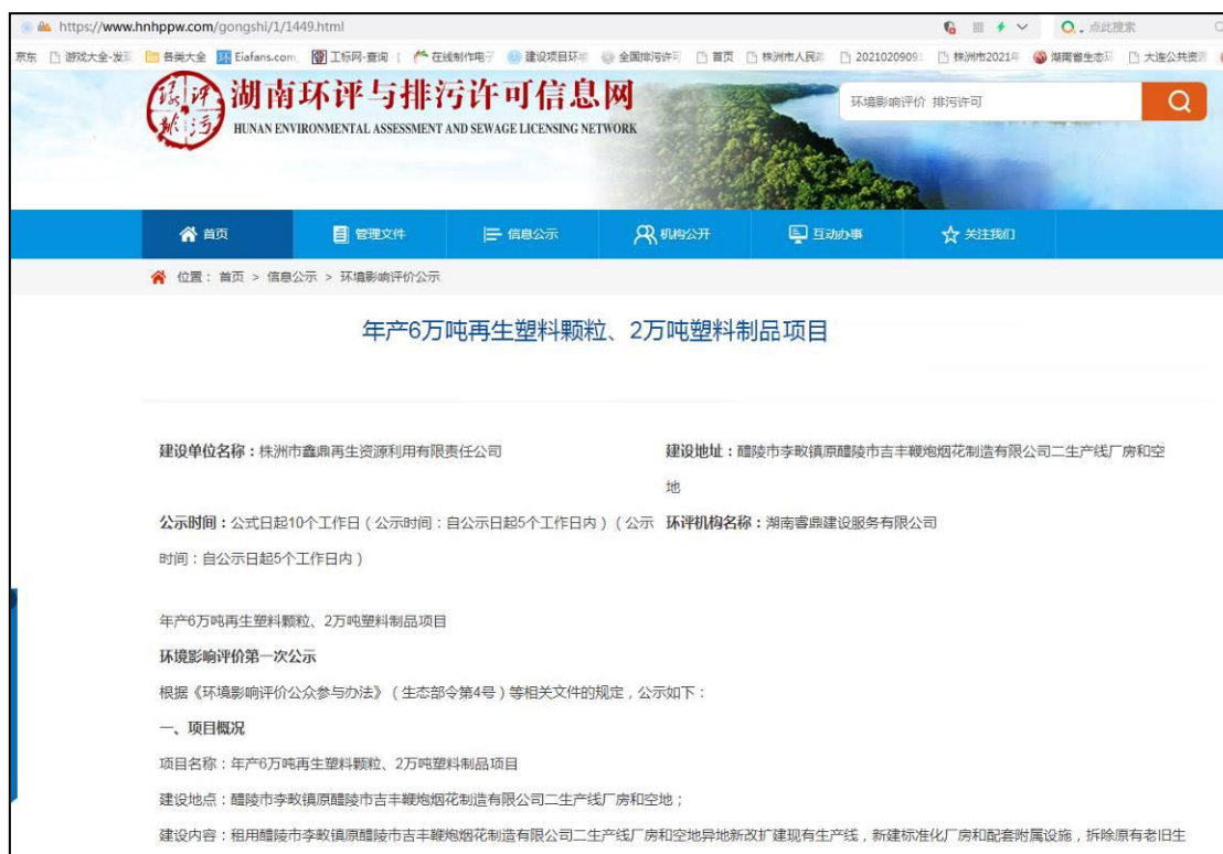
图 2-1 一次公示网络公示截图