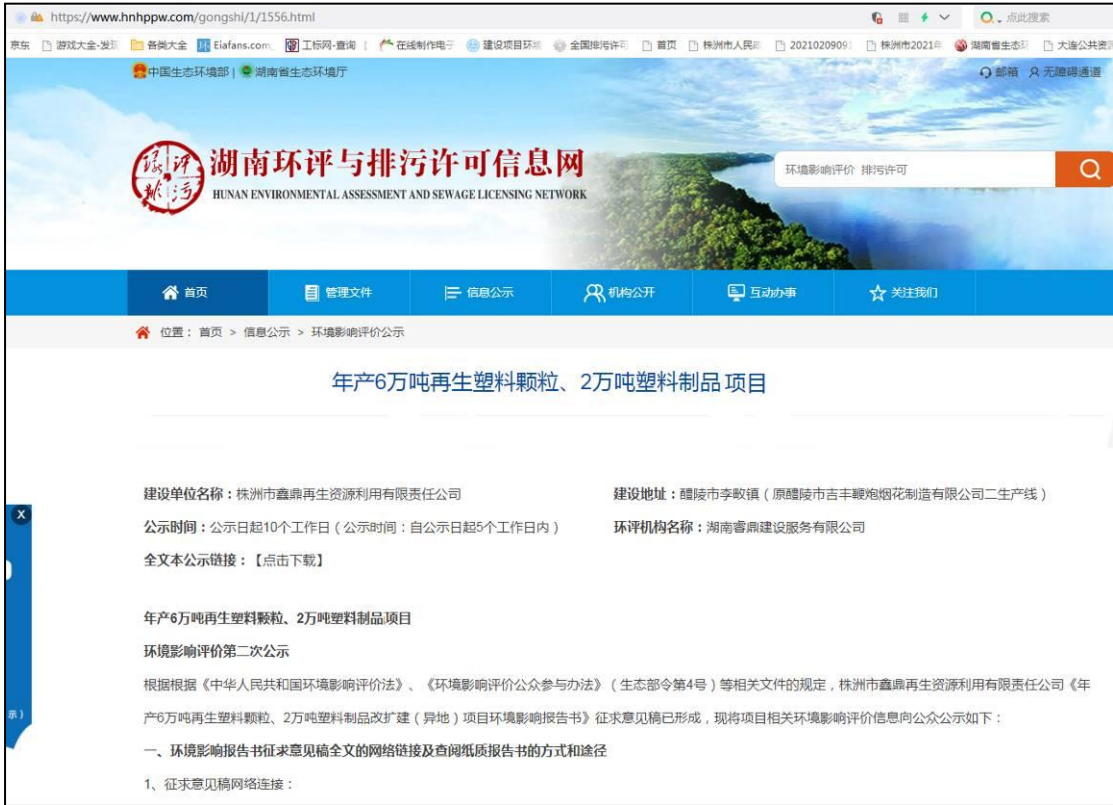
图 3-1 二次公示网络公示截图