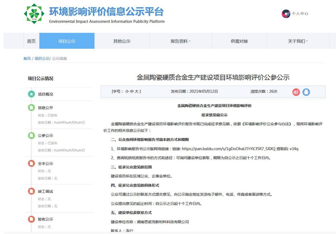
图 3.1 第二次网络公示截图