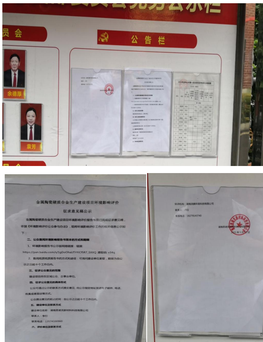
图 3.4 金钩山村公示现场照片

为广泛征求项目周边公众对本项目建设的意见，建设单位在场址周边村庄张贴公告，公示时间为 2021 年 5 月 13 日，公示照片见图 3.4。