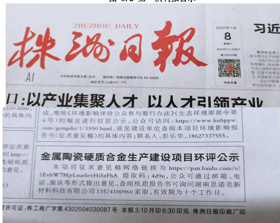
图 3.3 第二次刊报公示