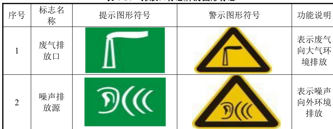
表 4-14 排放口标志牌的图形标志