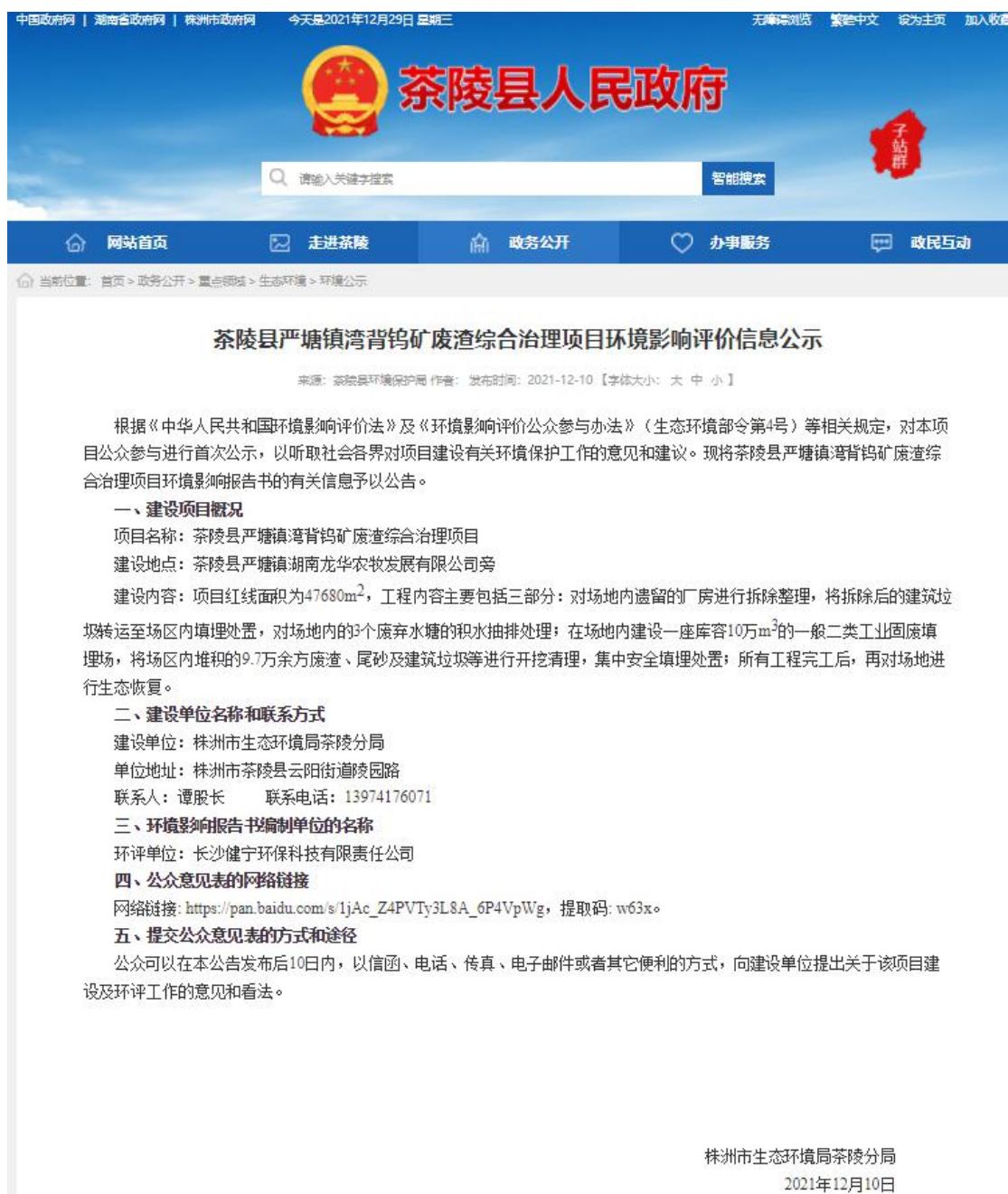
图1 首次环境影响评价信息公开网络公示截图

本项目首次环境影响评价信息公开是在茶陵县人民政府网站进行公示，符合《环境影响评价公众参与办法》要求。