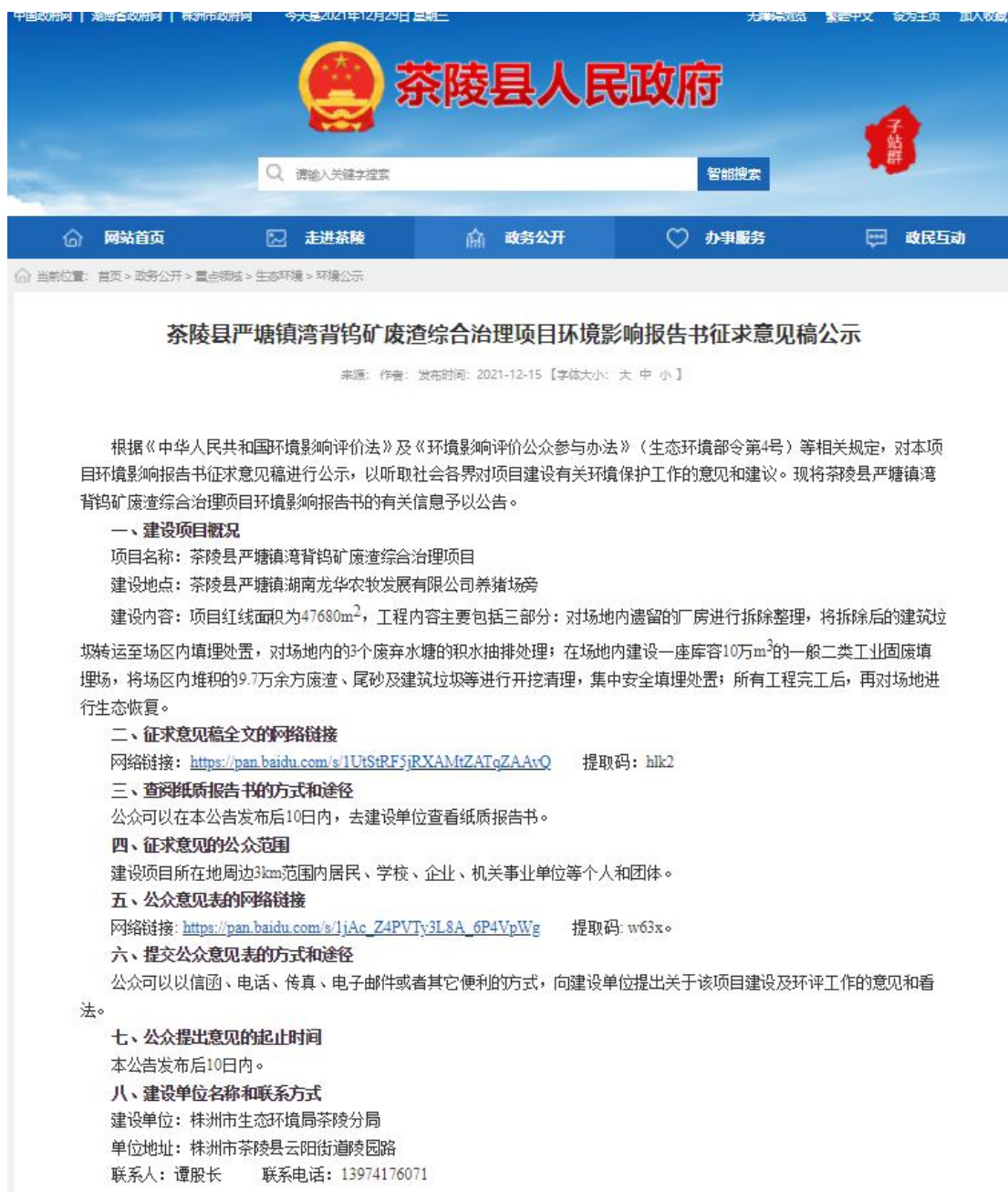
图2 征求意见稿网络公示截图

本项目征求意见稿公示是在茶陵县人民政府网站进行公示，符合《环境影响评价公众参与办法》要求。