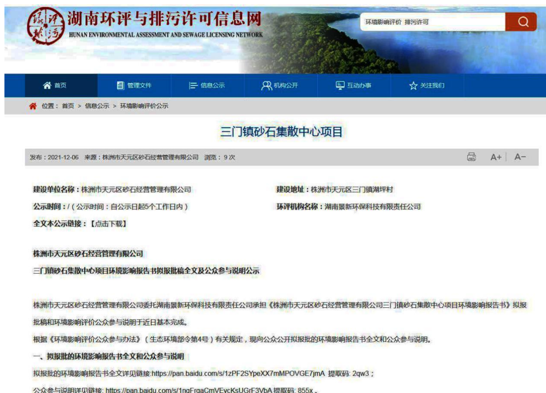
图 7 拟报批稿全文和公众参与说明网络公示截图

公司于 2021 年 12 月 6 日通过网络公示的方式对本工程拟报批的环境影响报告书全文和公众参与说明进行了公示，公示网络媒体为湖南环评与排污许可信息网网站（ https://www.hnhppw.com/gongshi/4/1221.html ），符合《环境影响评价公众参与办法》的要求。