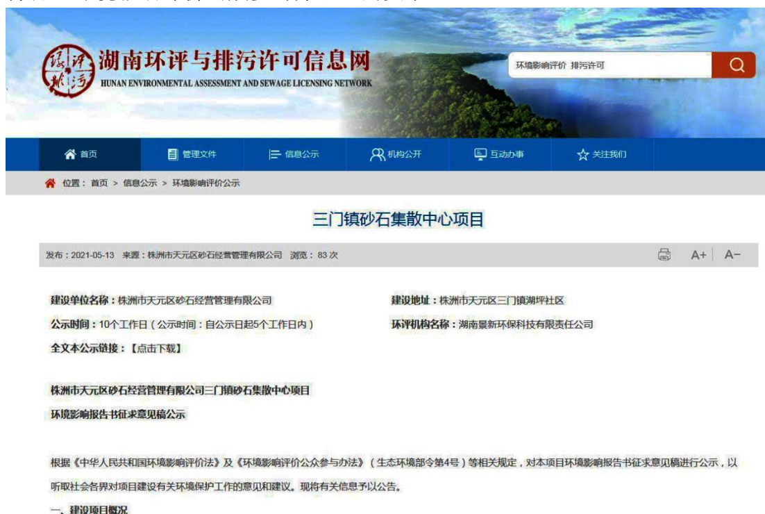
图2 征求意见稿网络公示截图

( https://www.hnhppw.com/gongshi/1/1175.html ), 持续公开期限为10个工作日, 符合《环境影响评价公众参与办法》的要求。