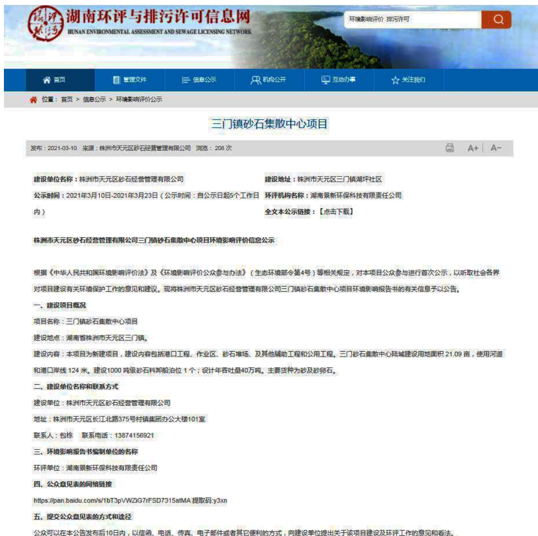
图 1 首次网络公示截图