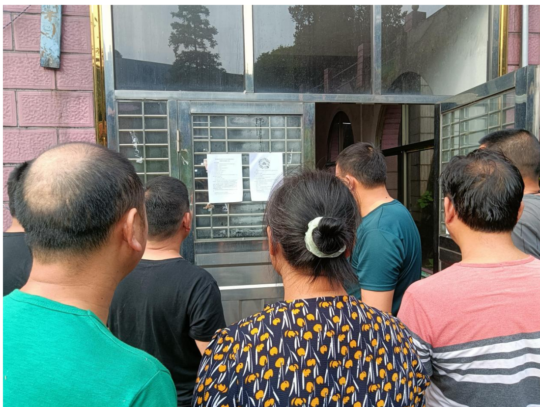
图3-4 第二次现场公示