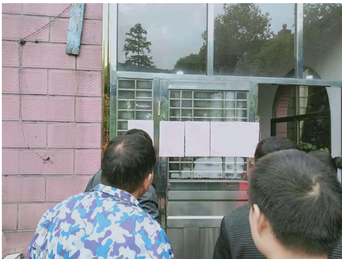
图2-1 第一次现场公示截图