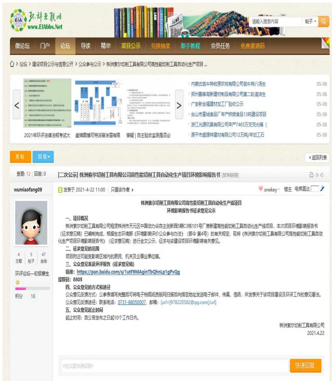
图 3.2-1 征求意见稿网上公示截图