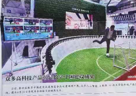
众多高科技产品彰显数字中国建设成果

本报讯 4月26日，商务部与湖南省政府签署了新一轮省合作框架协议。该协议是在双方此前签署的省合作框架协议基础上，进一步深化合作、扩大合作领域、提升合作水平的成果。新一轮省合作框架协议涵盖了货物贸易、服务贸易、投资、金融、人员往来、数据流动等多个领域，旨在进一步优化营商环境，提升贸易便利化水平，推动湖南省经济高质量发展。