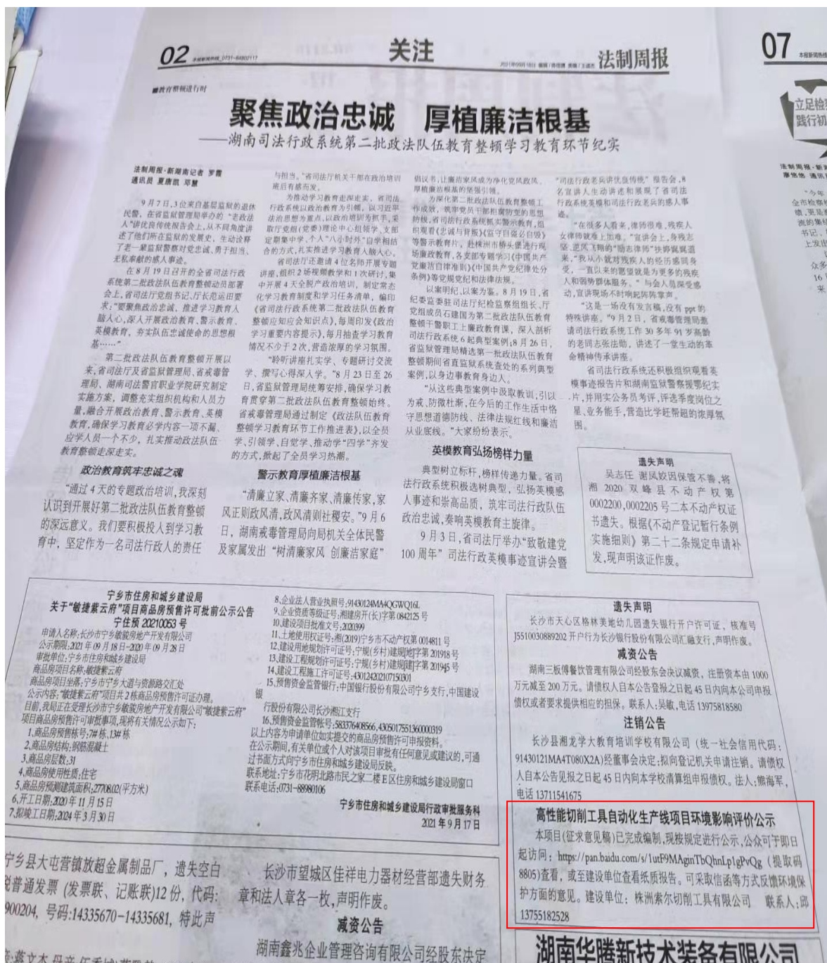
图 3.2-5 第二次报纸补充公示（第 112 期 02 版）