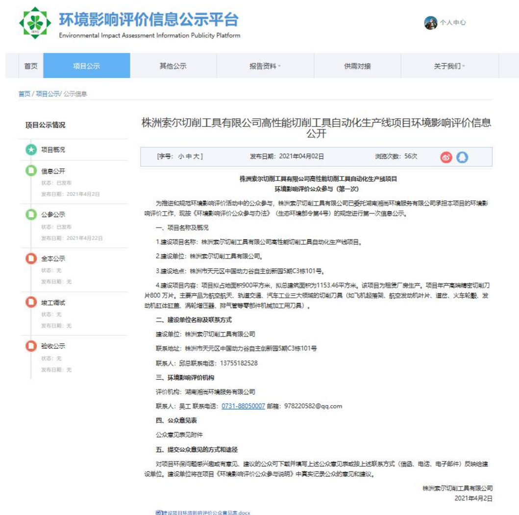
图 2.2-1 首次环境影响评价信息公示截图