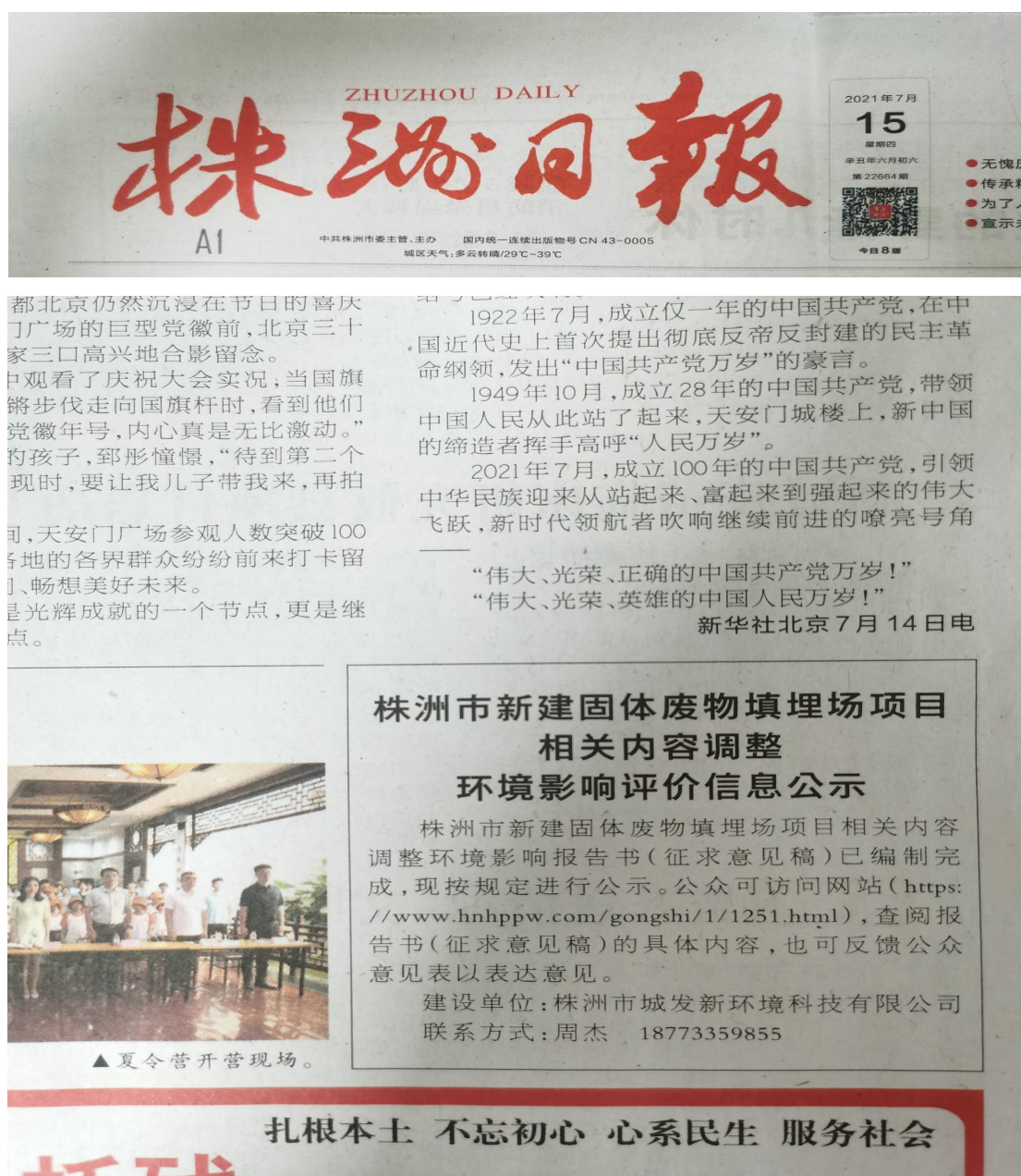
图 3 第一次报纸公示照片

我公司分别于 2021 年 7 月 15 日和 2021 年 7 月 16 日在《株洲日报》上进行了两次本项目环境影响报告书征求意见稿公示,株洲日报是项目所在地发行量较大、公众易于接触到的报纸,且在征求意见的 10 个工作日内登报公示了 2 次,符合《环境影响评价公众参与办法》的要求。