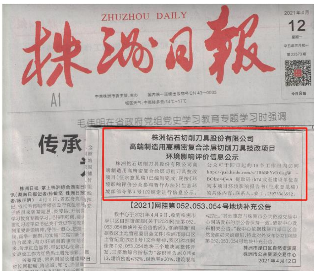
图 3-2 报纸公示截图（一）