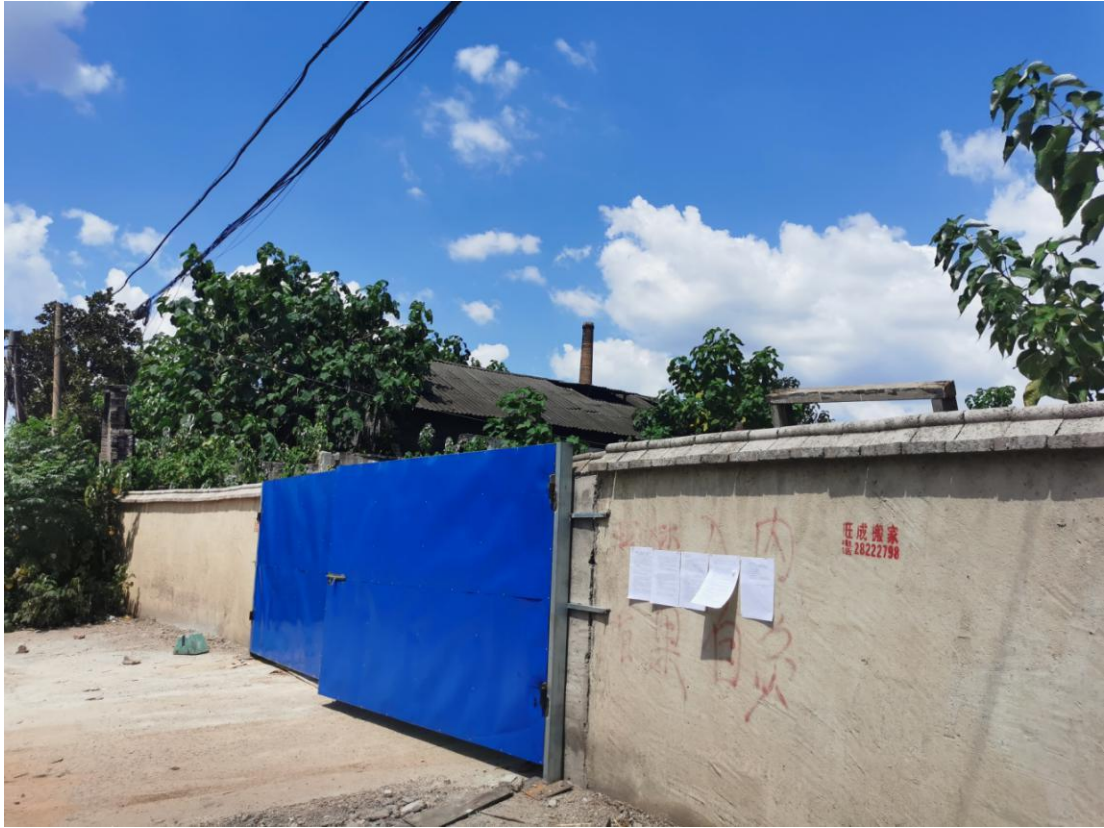
图 3-4 第二次现场公示