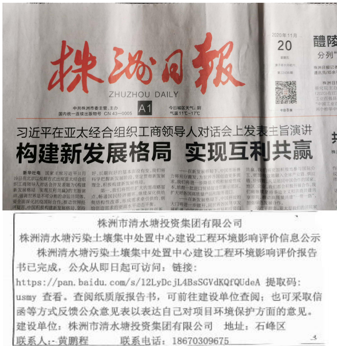
图 3-2 报纸公示（2020 年 11 月 20 日）