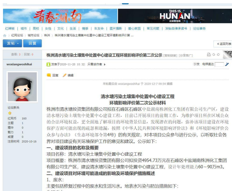
图 3-1 第二次网上公示截图