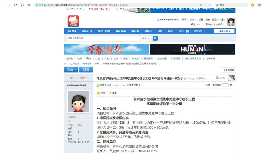
图 2-1 第一次网上公示截图