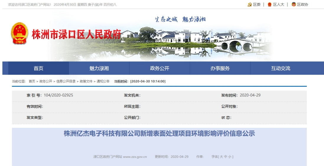
图 1 征求意见稿网络公示截图 1