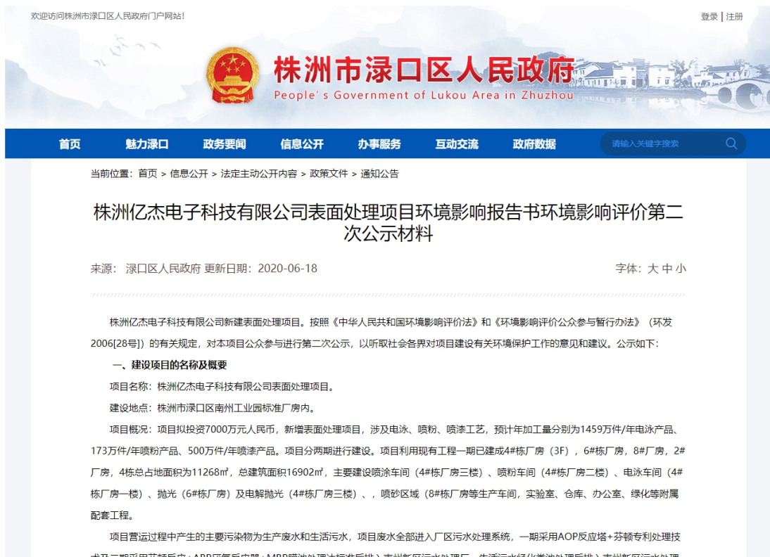
图 2 征求意见稿网络公示截图 2