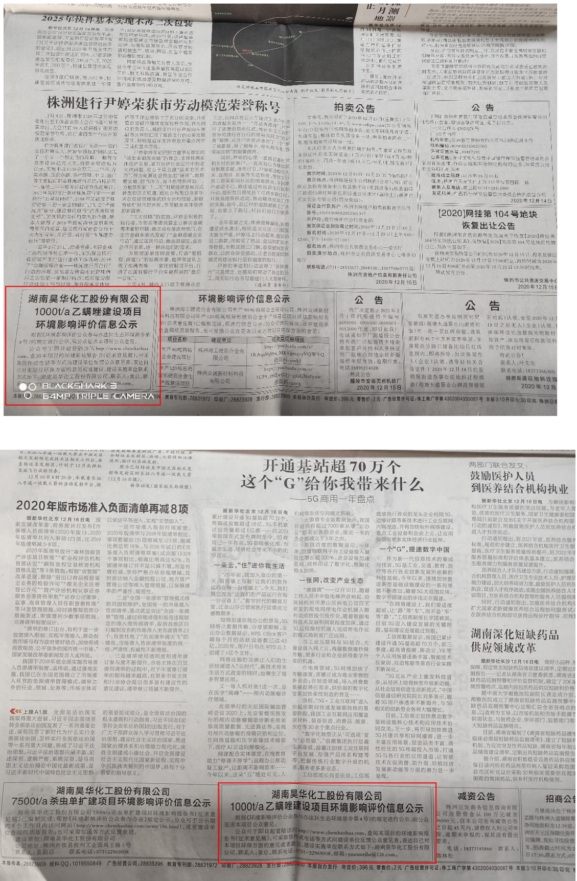
图3 第二次报纸公示截图