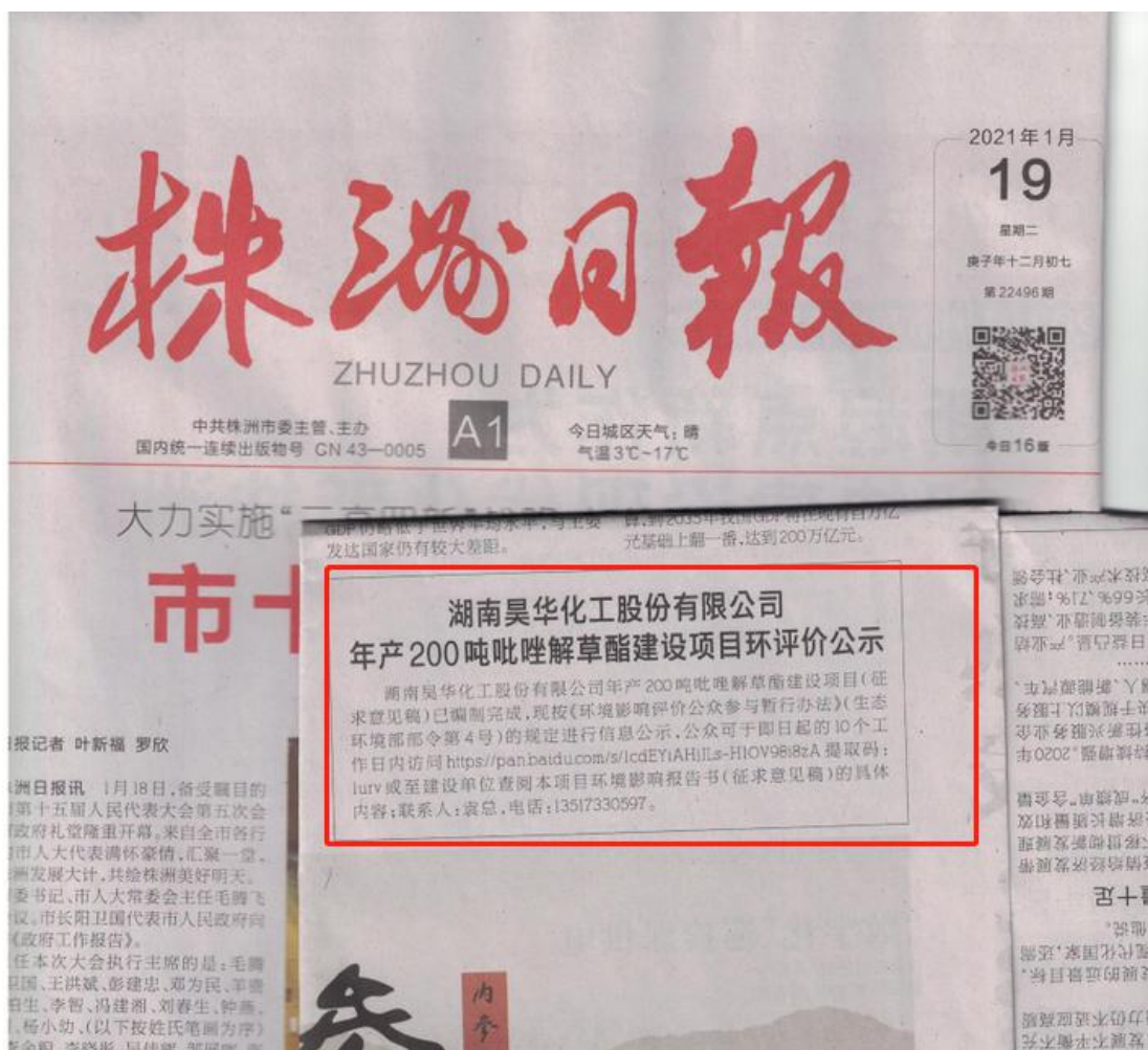
图 3-2 报纸公示截图（一）