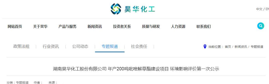
图 2-1 网络公示截图