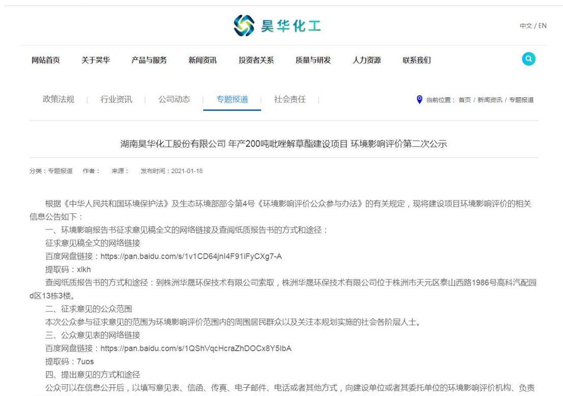
图 3-1 网络公示截图