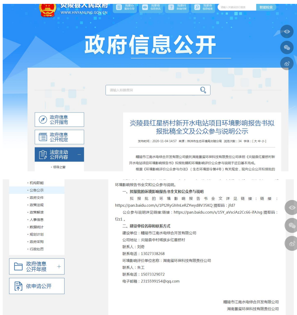
图6 拟报批稿全文和公众参与说明 网络公示截图