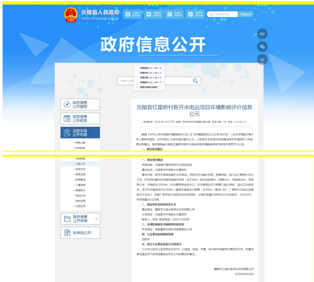
图 1 首次网络公示截图