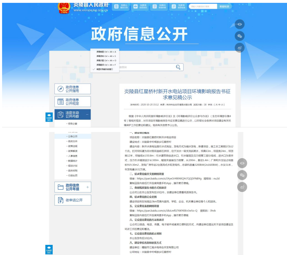
图 2 征求意见稿网络公示截图

建设单位于 2020 年 10 月 20 日通过网络公示的方式进行了本工程环境影响报告书征求意见稿公示，公示网络媒体为炎陵县人民政府网站（ http://www.hnyanling.gov.cn/c14920/20201020/i1601505.html ），炎陵县人民政府网站为建设项目所在地相关政府网站，持续公开期限为 10 个工作日，符合《环境影响评价公众参与办法》的要求。