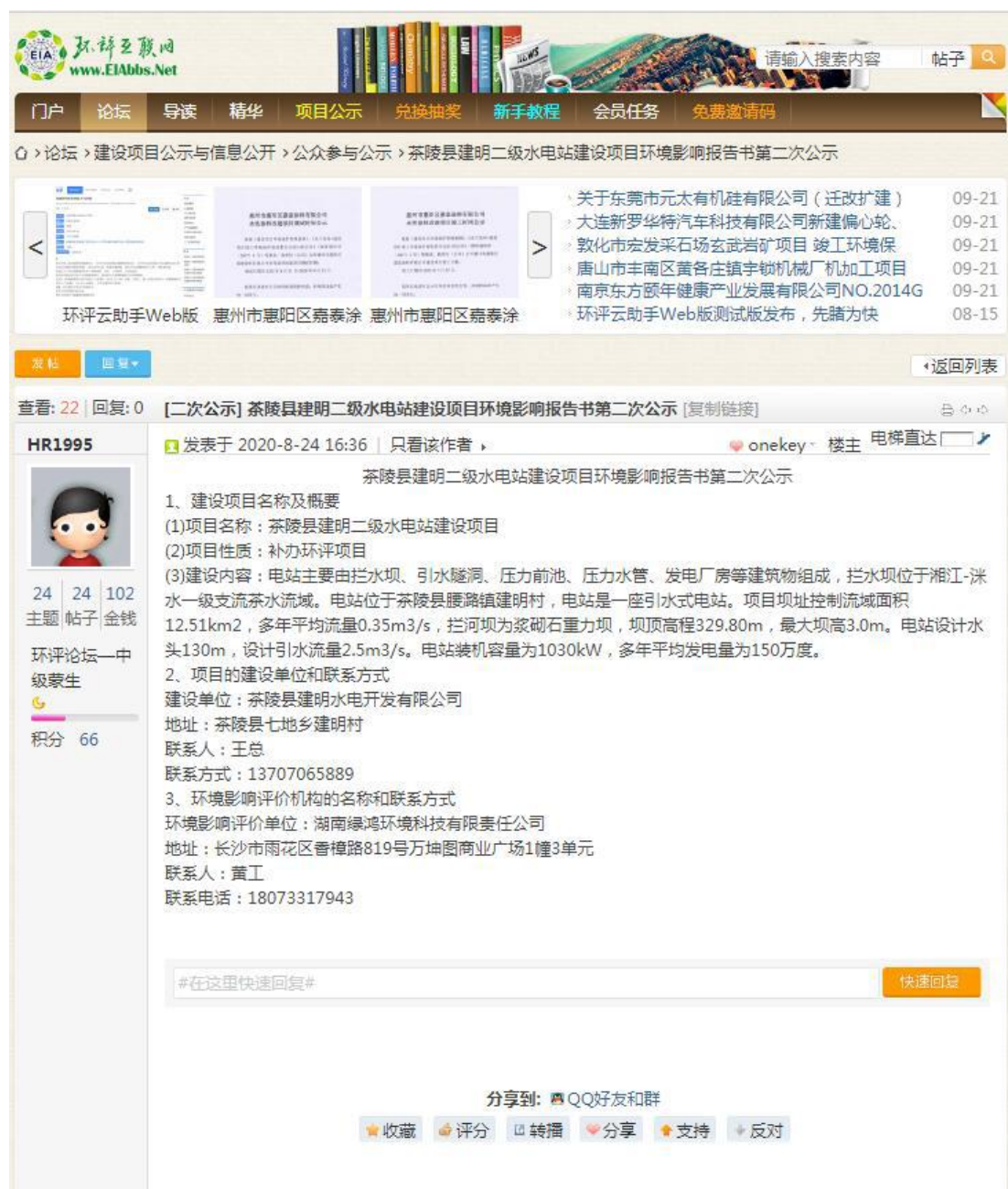
图 4 征求意见稿网络公示截图