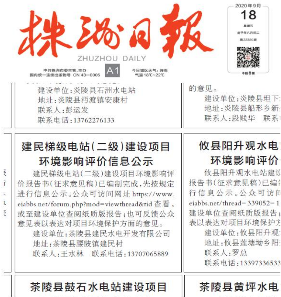
图3 2020年9月18日在《株洲日报》公示截图

我单位于2020年8月24日至2020年9月8日连续10个工作日在环评互联网进行了（征求意见稿）公示，公示载体符合《环境影响评价公众参与办法》“通过网络平台公开，且持续公开期限不得少于10个工作日”的要求。此次网络公示时间为2020年8月24日至2020年9月8日，公示时间为10个工作日。网上公示截图见图4。