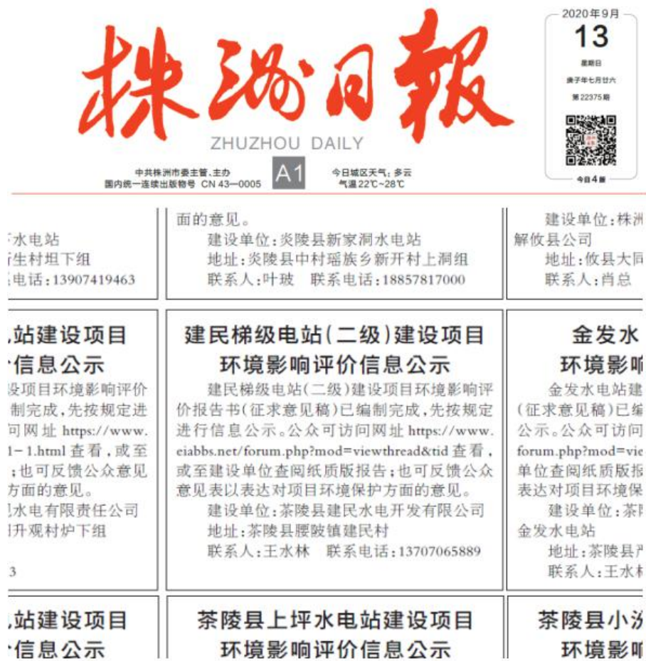
图 2 2020 年 9 月 13 日在《株洲日报》公示截图