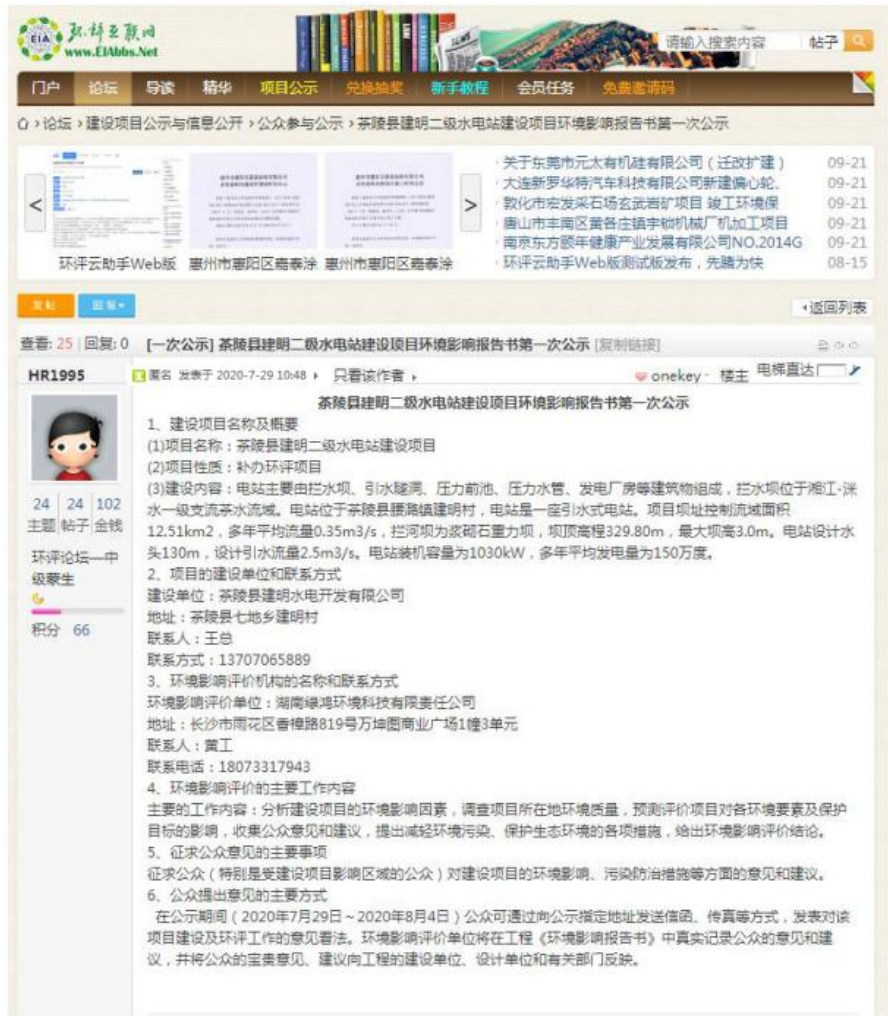
图 6 报告书全文和公众参与说明网络公示截图