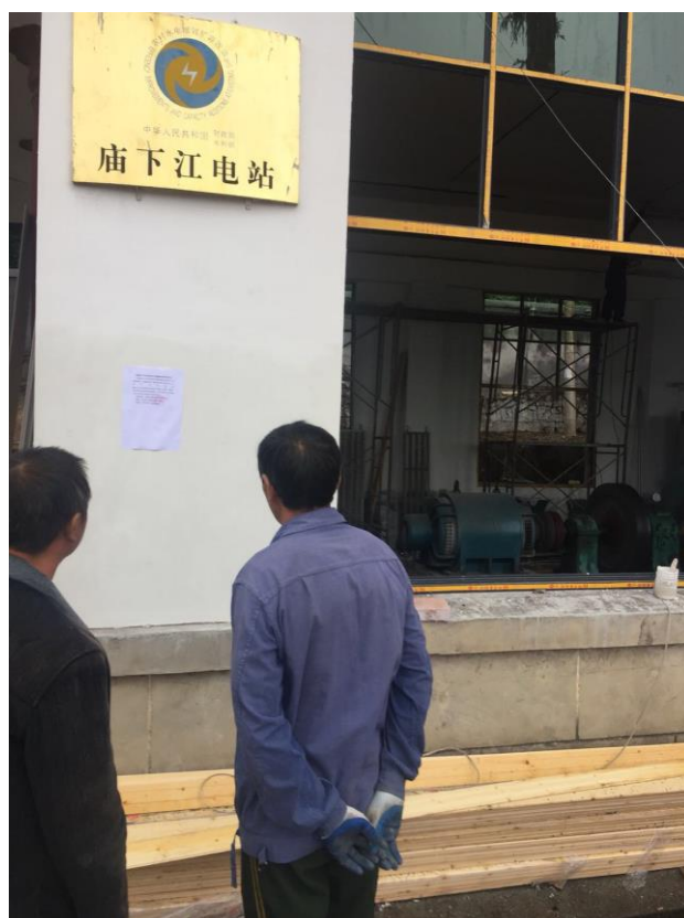
征求意见稿公示——现场公示截图