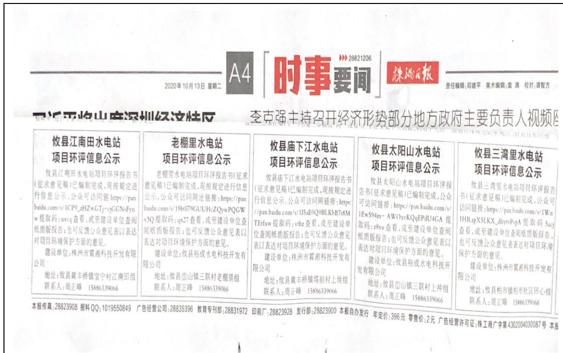
征求意见稿公示——第一次报纸公示截图