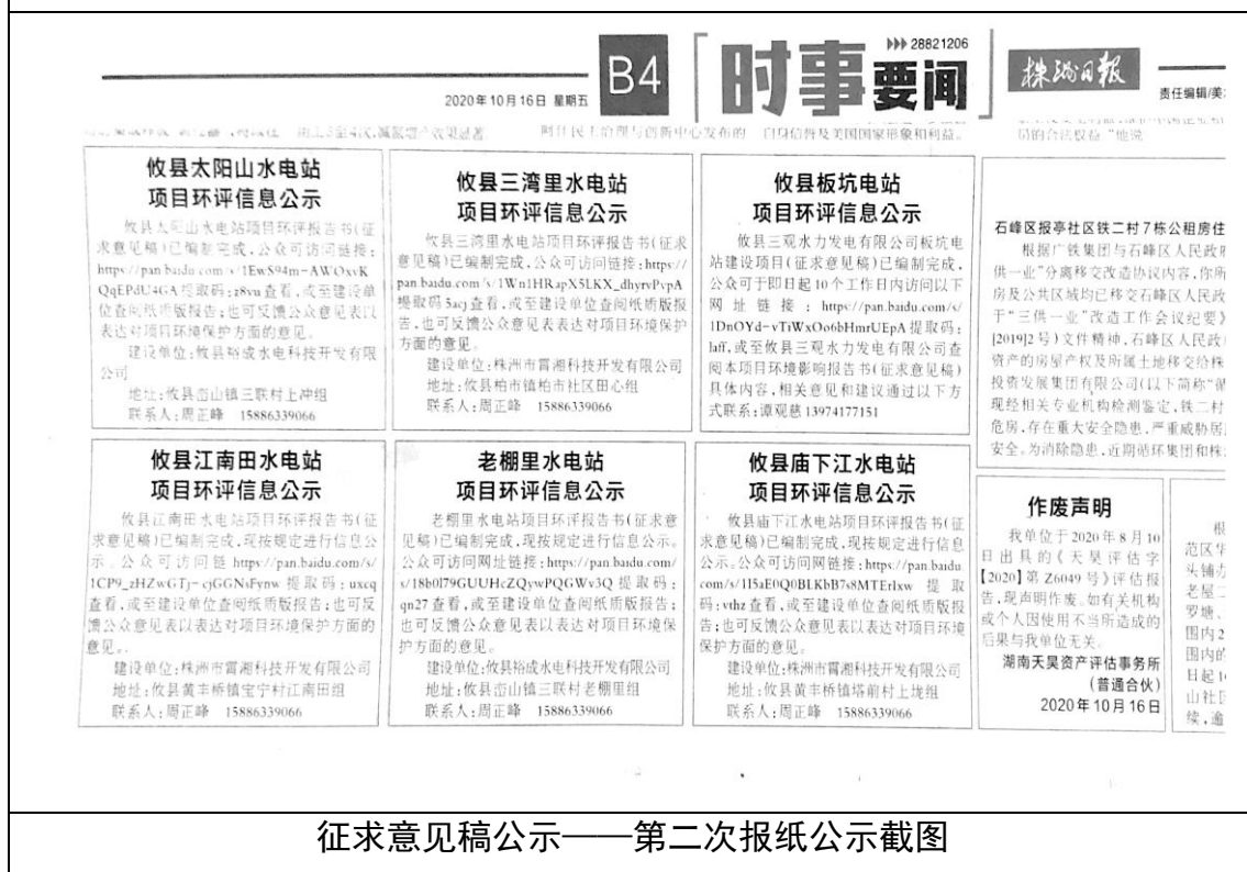
征求意见稿公示——第二次报纸公示截图