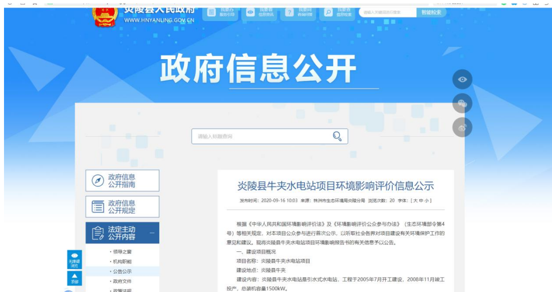
图 2 征求意见稿网络公示截图

建设单位于 2020 年 9 月 16 日通过网络公示的方式进行了本工程环境影响报告书征求意见稿公示，公示网络媒体为炎陵县人民政府网站（ http://www.hnyanling.gov.cn/c14920/20200916/i1588526.html ），炎陵县人民政府网站为建设项目所在地相关政府网站，持续公开期限为 10 个工作日，符合《环境影响评价公众参与办法》的要求。