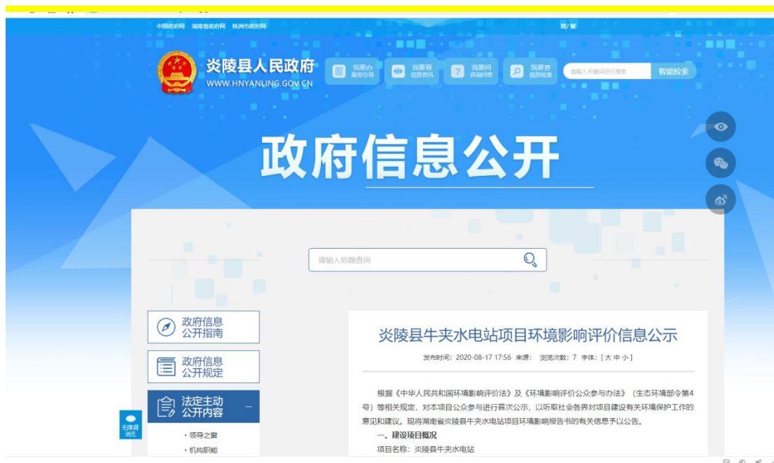
图 1 首次网络公示截图