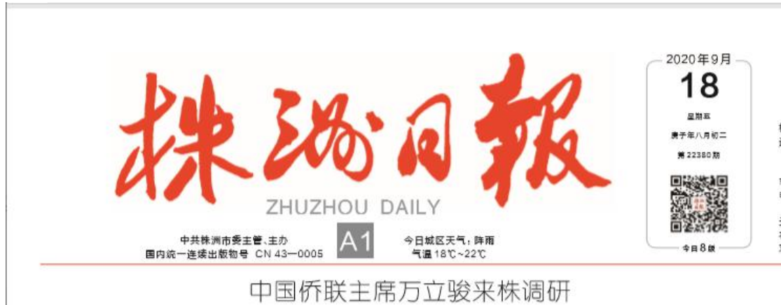
图 3 株洲日报第一次报纸公示照片