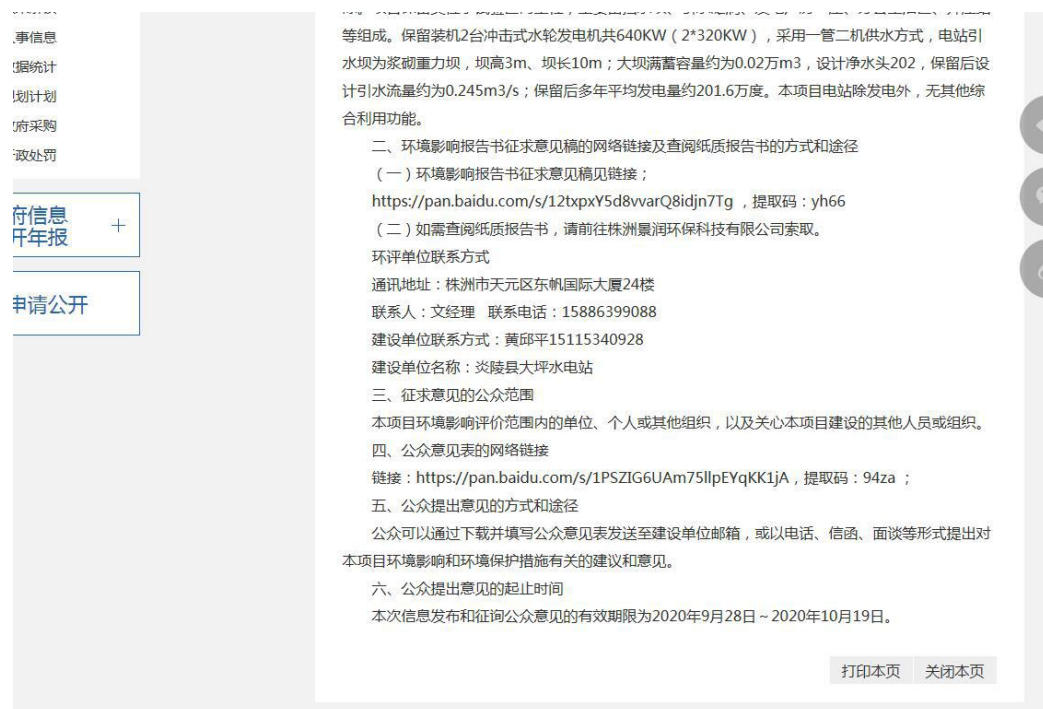
图 3-1 网络公示截图