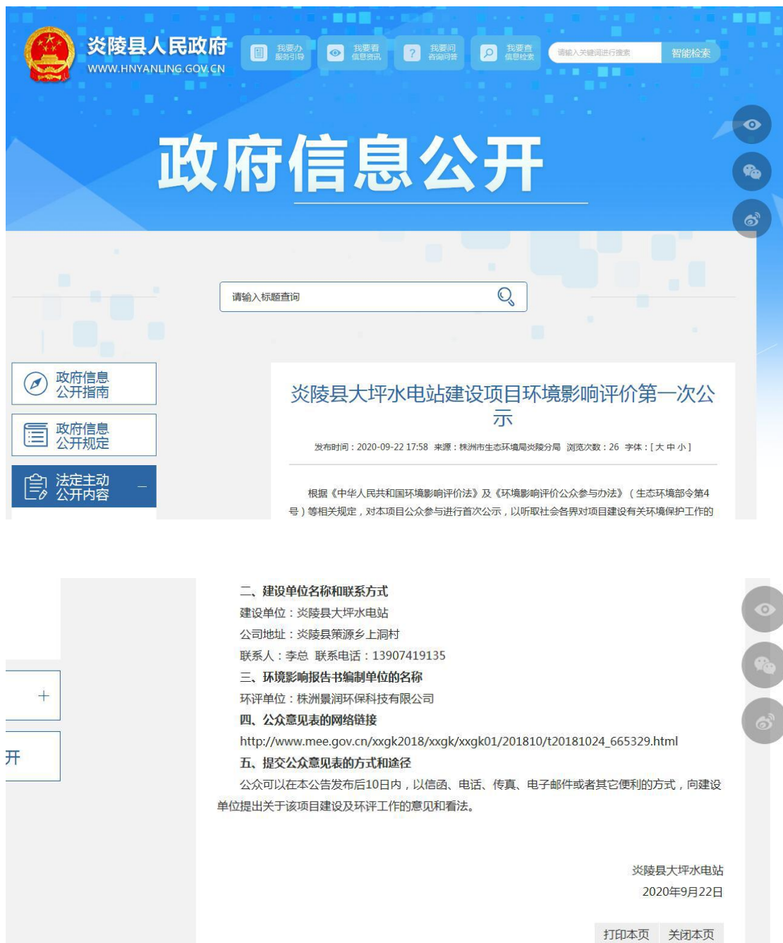
图 2-1 第一次公示