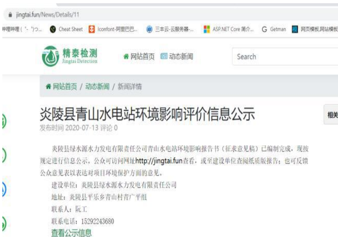
图 2 信息公示网络公示截图