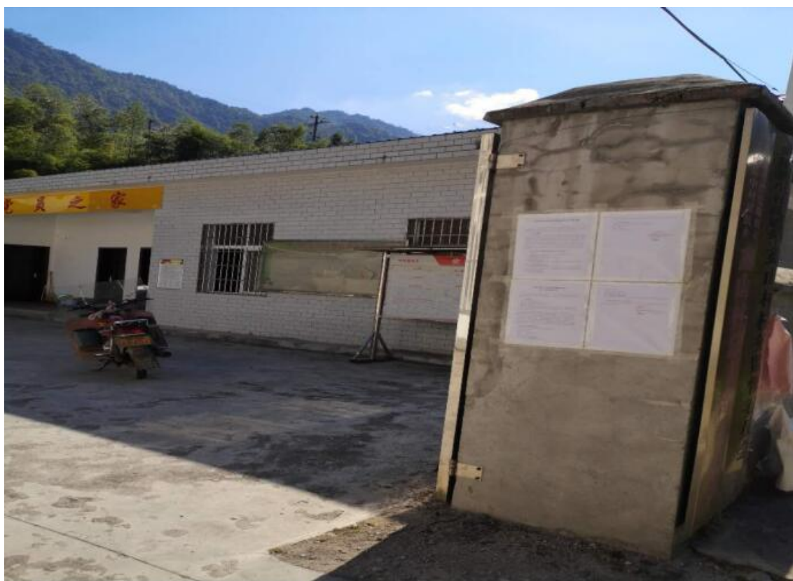
图 1 信息公示现场公示照片