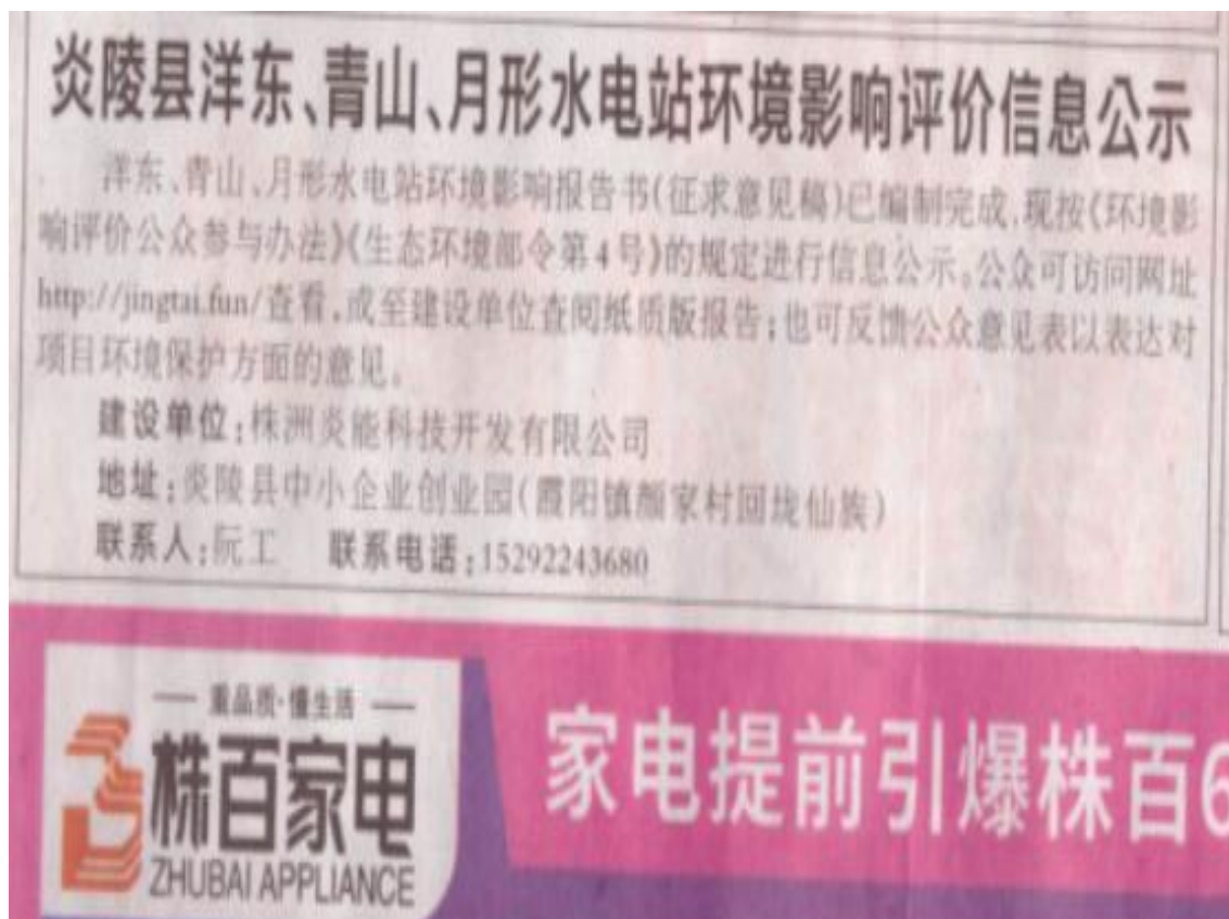
图4 信息公示报纸截图