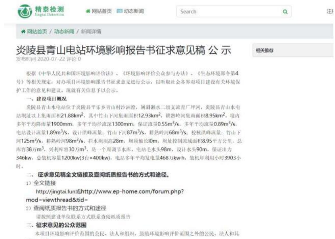
图 3 征求意见稿网络公示截图

本项目征求意见稿公示是在环保之家及 http://jingtai.fun 网站进行公示,符合《环境影响评价公众参与办法》要求。