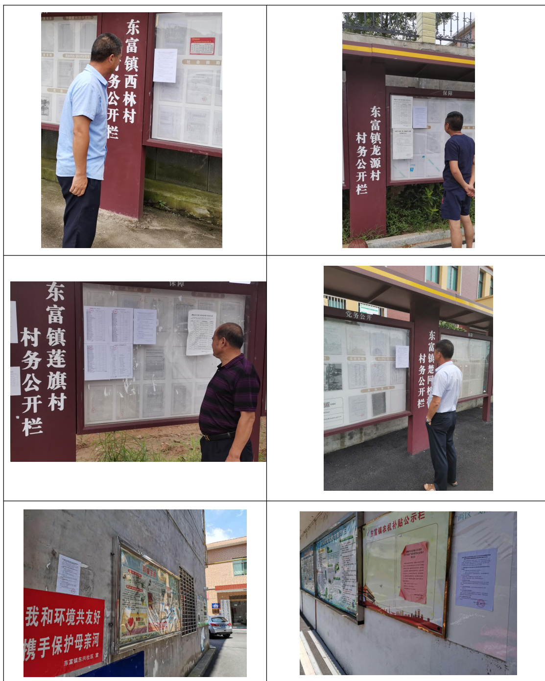
图 5 张贴公示照片

本单位于 2020 年 6 月 29 日在西林村、龙源村、莲旗村、楚同桥村、东兴社区、东富镇政府等公告栏处进行了张贴公示，张贴处为项目选址近距离敏感点，符合《环境影响评价公众参与办法》（生态环境部令第 4 号）要求。