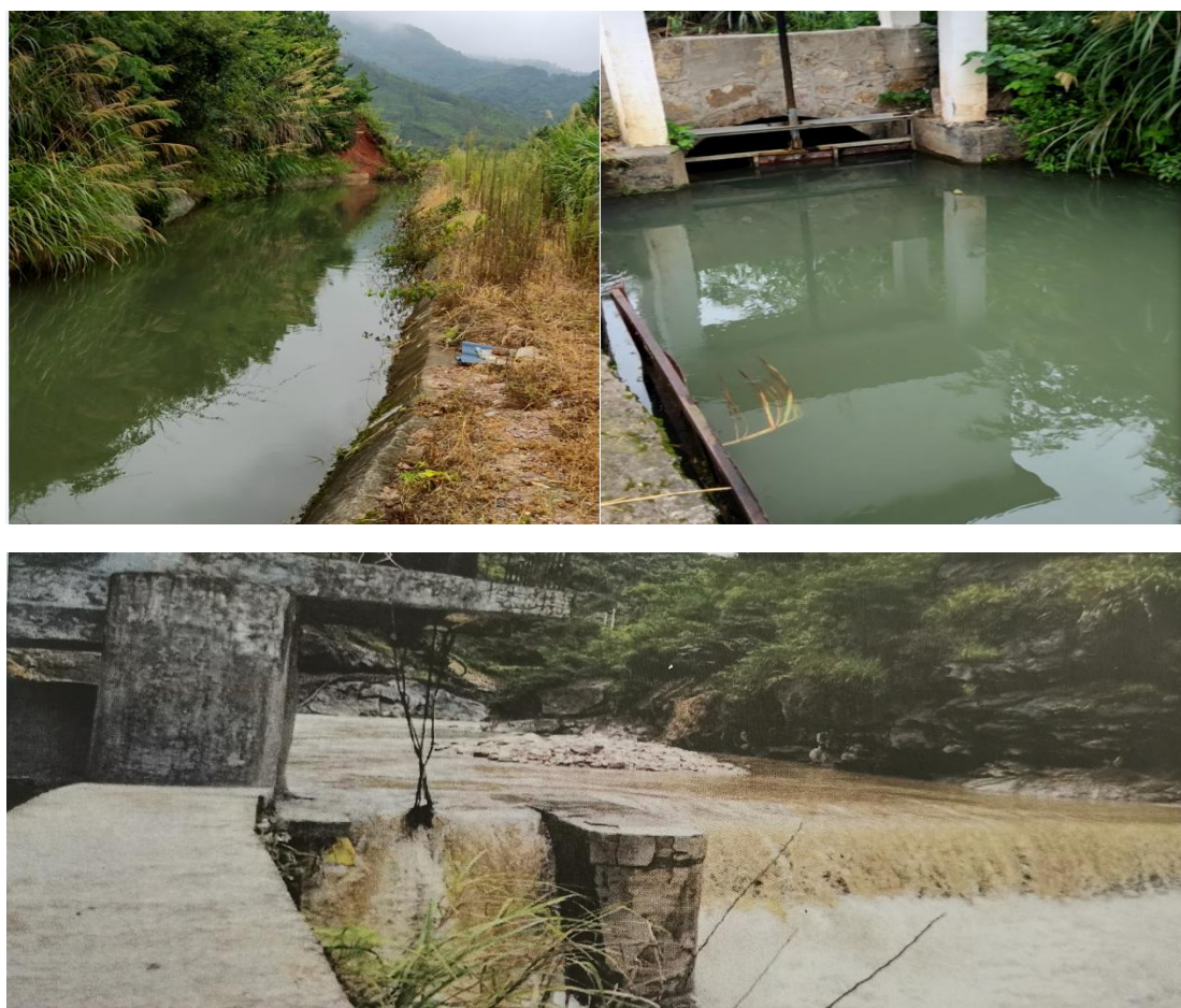
图 1-2 引水渠、分水口（前池）、引水坝现状