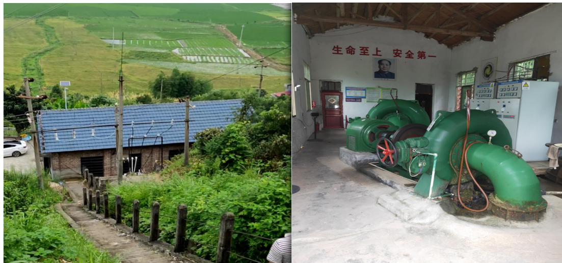
图 1-1 厂房及设备现状