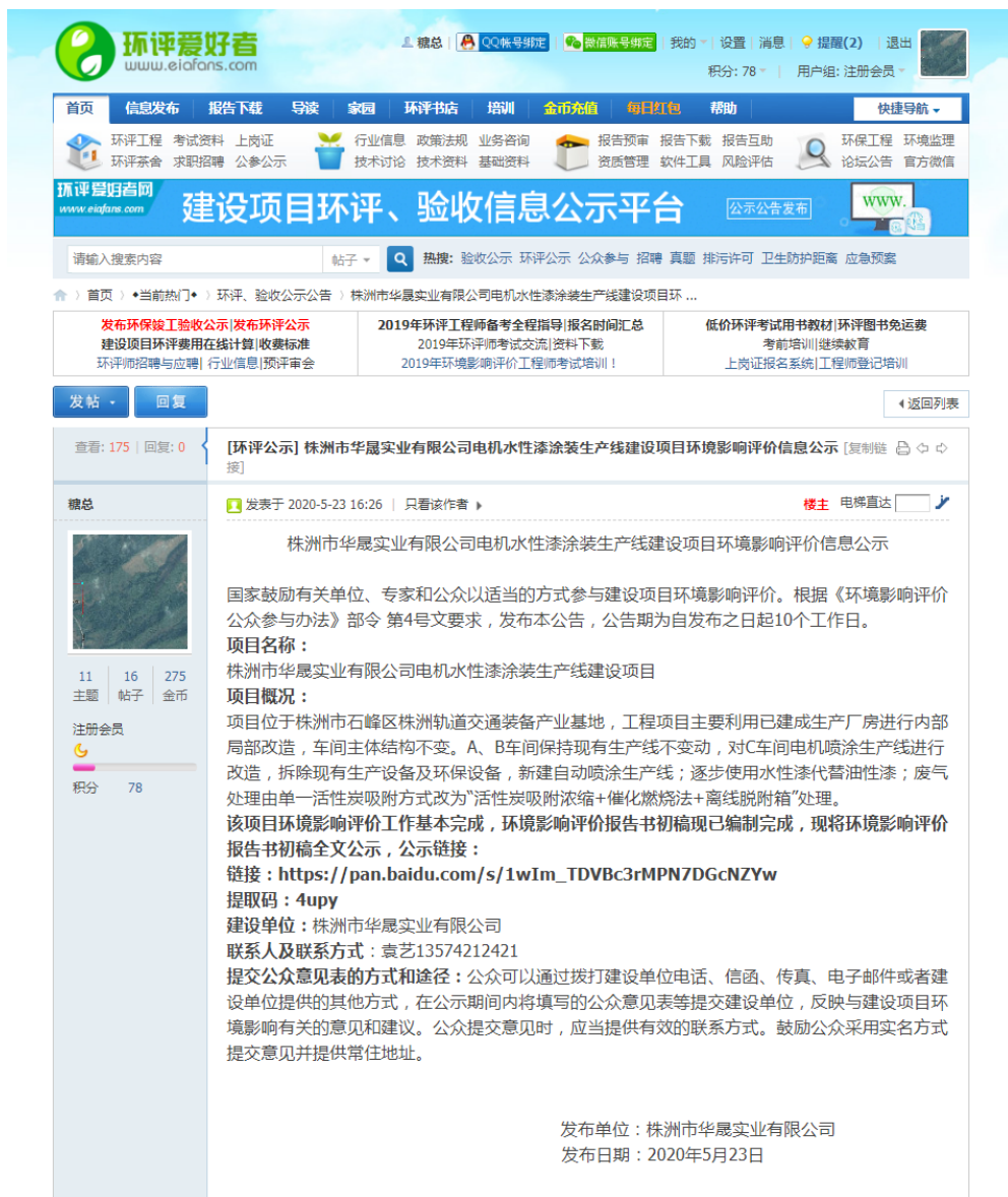
图 3 第二次网络公示