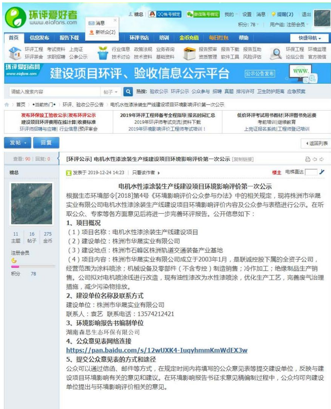
图 1 第一次网络公示