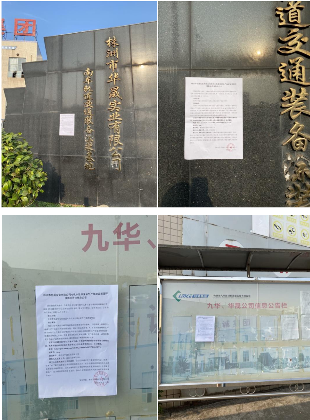
图 2 现场张贴公示