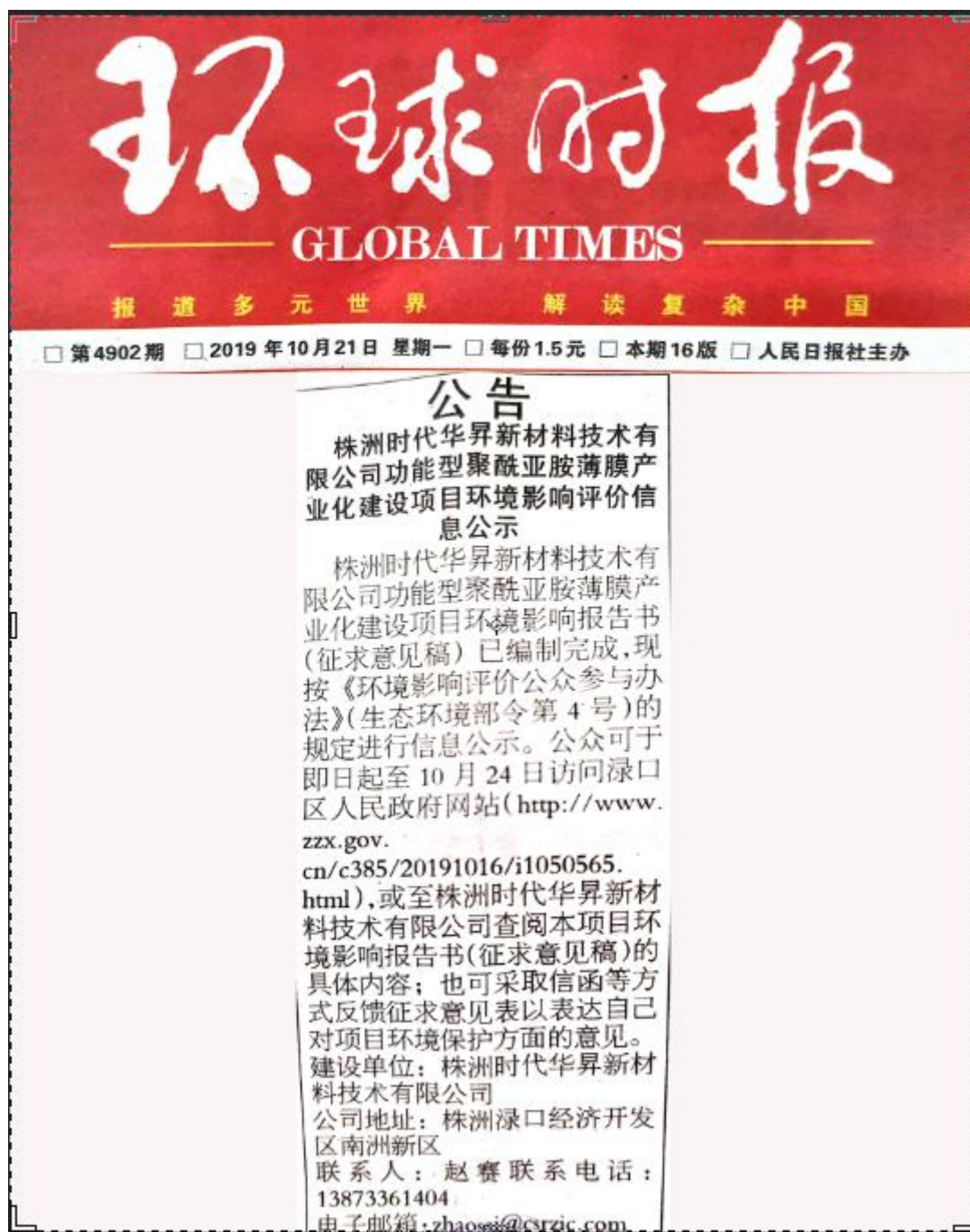
图4 第二次报纸公示照片

本公司又于2020年5月27日和2020年5月29日通过报纸公示的方式进行两次了本工程环境影响报告书征求意见稿公示,公示报纸为株洲日报2020年5月27日第22266期和2020年5月29日第22268期。