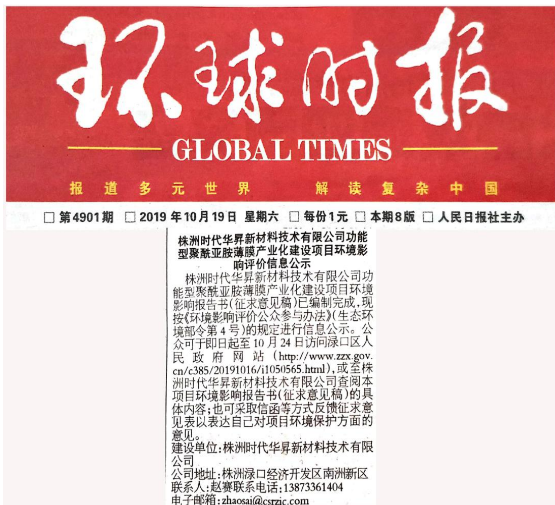
图3 第一次报纸公示照片