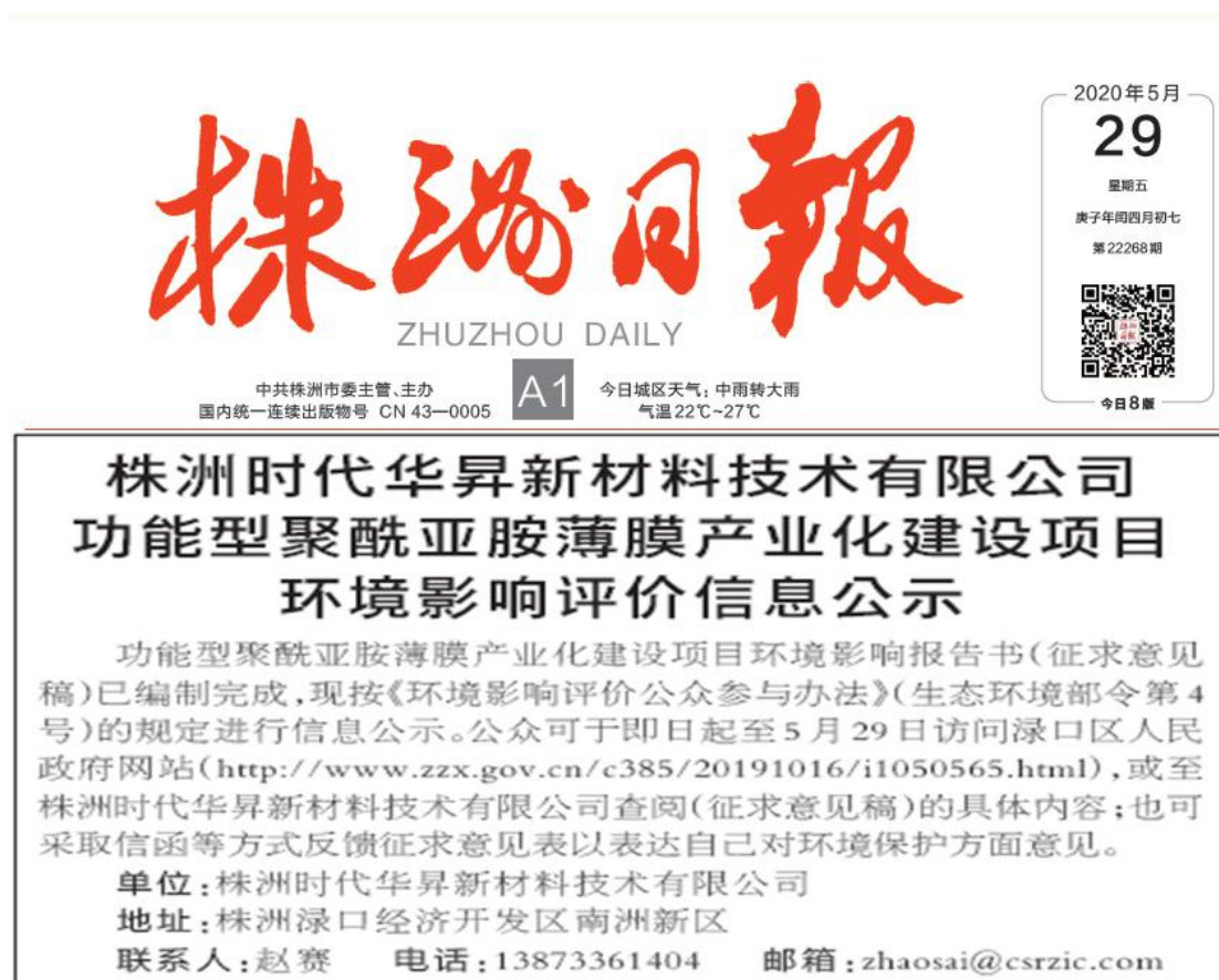
图4 第二次报纸公示照片

株洲日报和环球日报是项目所在地发行量较大、公众易于接触到的报纸,且在征求意见的10个工作日内登报公示了2次,符合《环境影响评价公众参与办法》的要求。