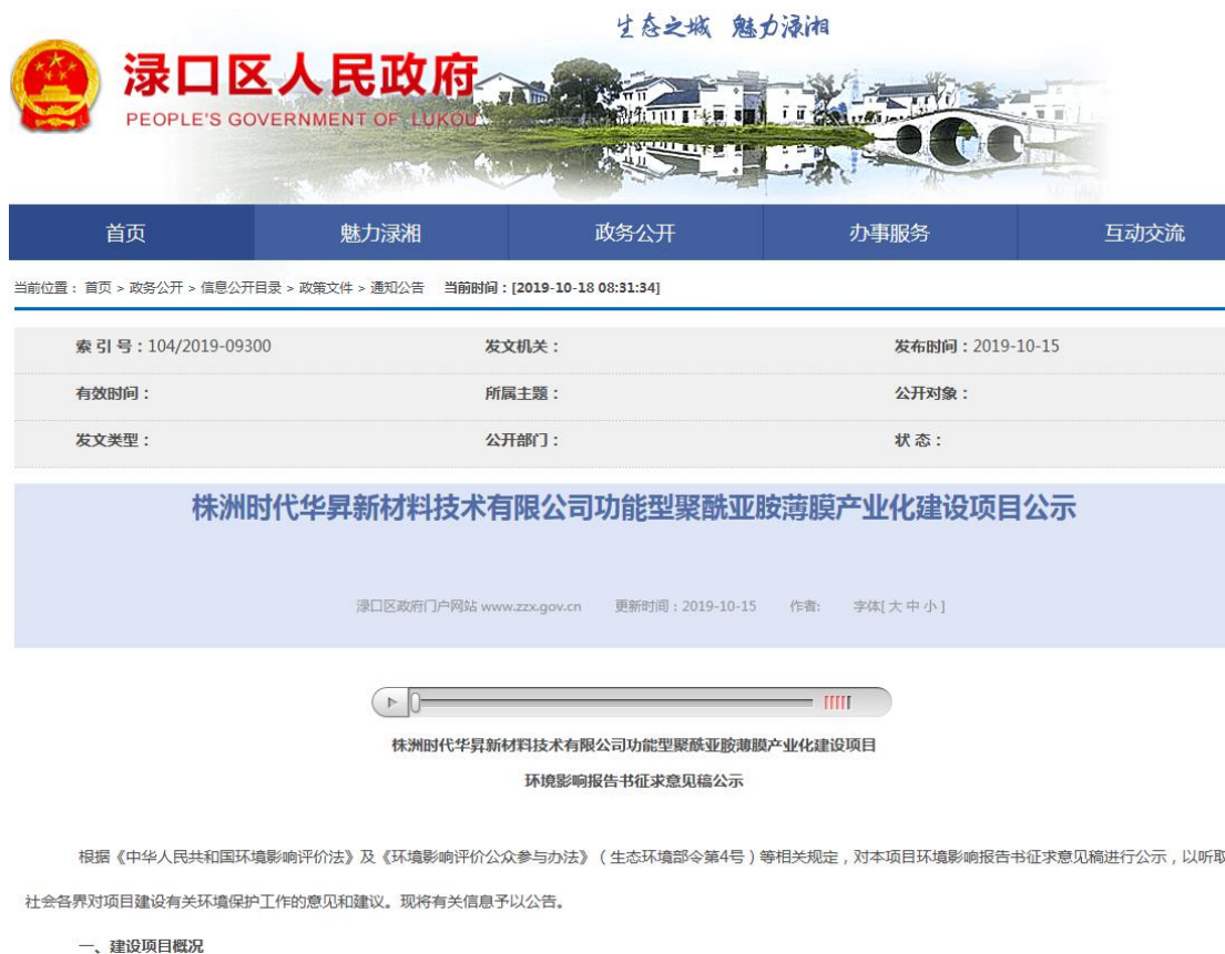
图2 征求意见稿网络公示截图