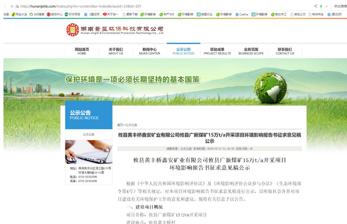
图 2 征求意见稿网络公示截图