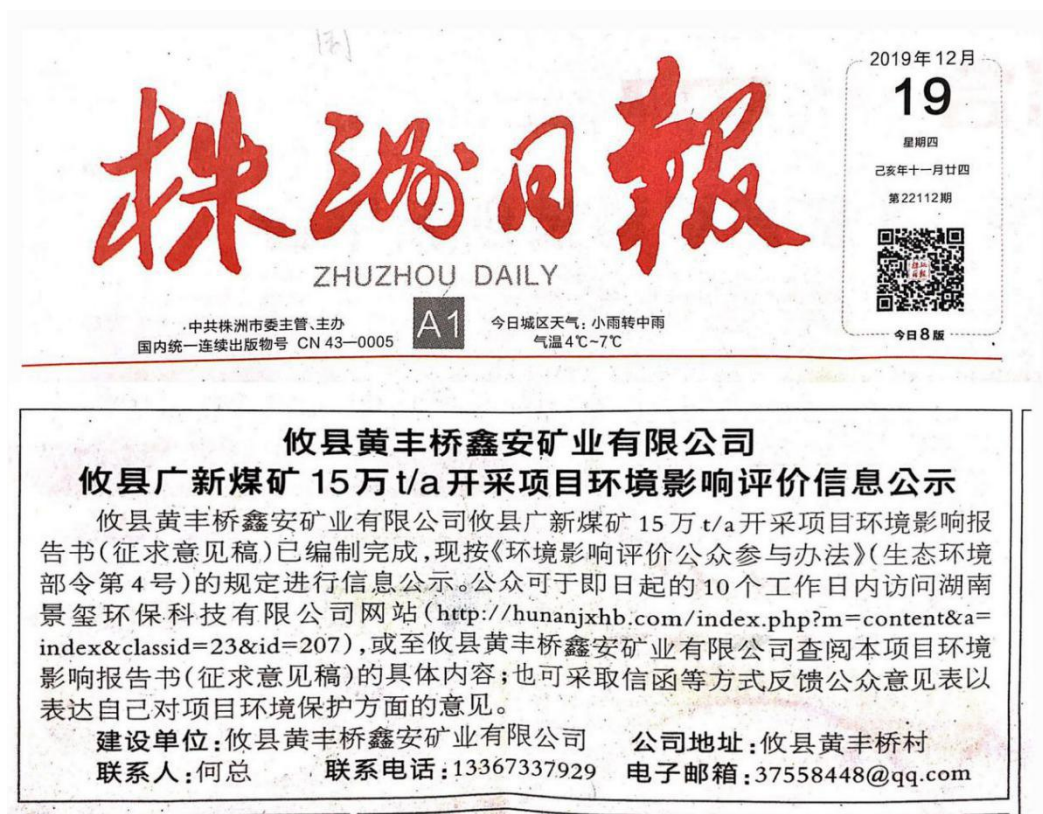
图3 第一次报纸公示照片